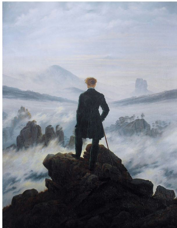
El caminante sobre el mar de nubes - Caspar David Friedrich (1818)

¿Habrá alguna situación en la que sentimientos incuestionablemente bellos puedan desbordarse hacia las magnitudes terribles de lo sublime? Debemos preguntarnos esto no como un ejercicio ocioso, sino porque de no hallar una respuesta satisfactoria, deberíamos descartar el argumento que nos dieron nuestros participantes: si aquello que puede sentirse y percibirse puede ser exteriorizado a través del arte, y si en el arte se ha buscado representar lo sublime tal como se muestra en la imagen siguiente, entonces lo sublime es algo que puede existir en los sentimientos de forma previa a su exteriorización en el arte.