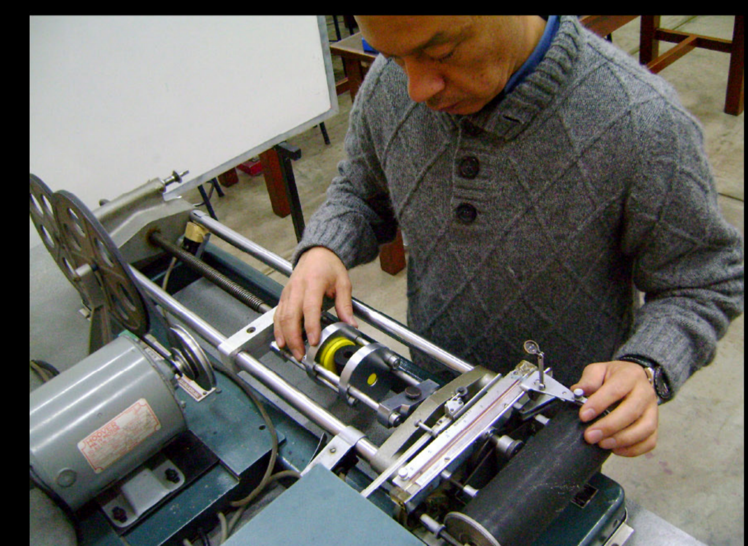
Briqueta ensayo de compresión.