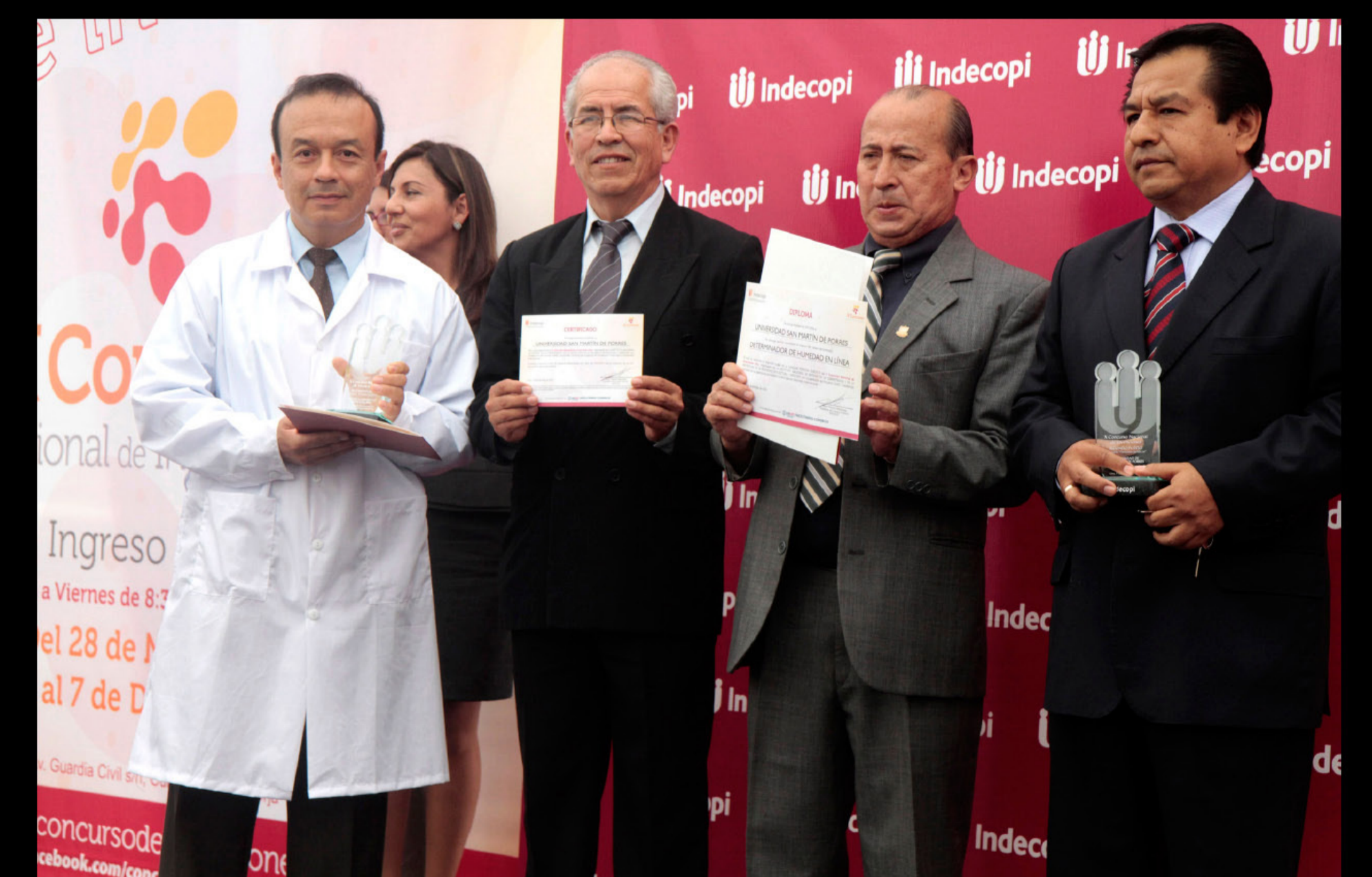
2do puesto Concurso Nacional de Invenções DIC 2011. Organizado por INDECOPI.