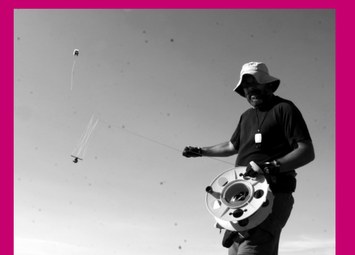
Uso de cometas en la toma de fotografías aéreas de baja altura utilizadas en la generación de modelos de elevación digitales.