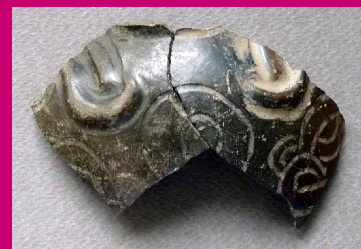
Fragmento de una botella de cerámica decorada en un estilo típico de la costa norte (Círculos concéntricos. Técnica de incisiones gruesas y aplicaciones en relieve).