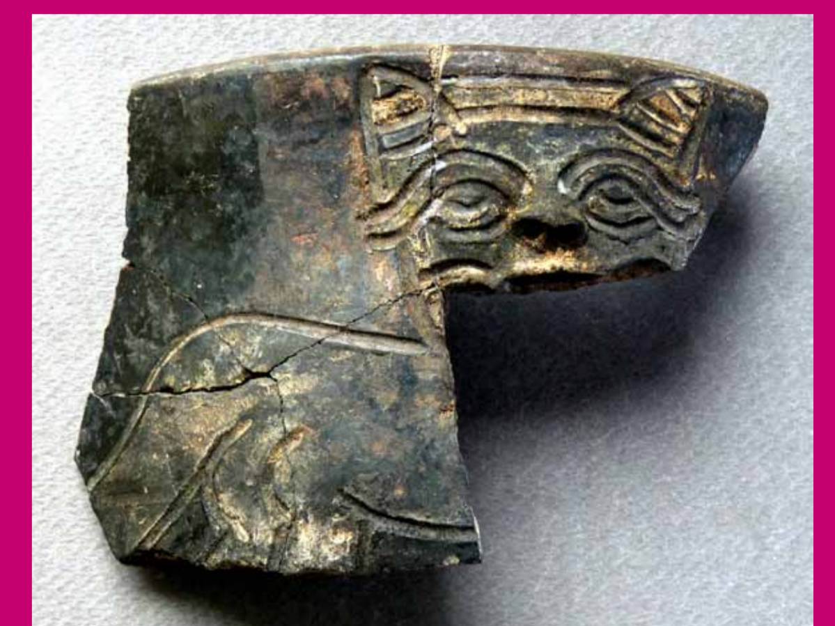
Fragmento de un cuenco de cerámica decorado en un estilo típico de la costa sur (Felino de perfil. Técnica de incisiones gruesas y pintura post cocción en zonas).