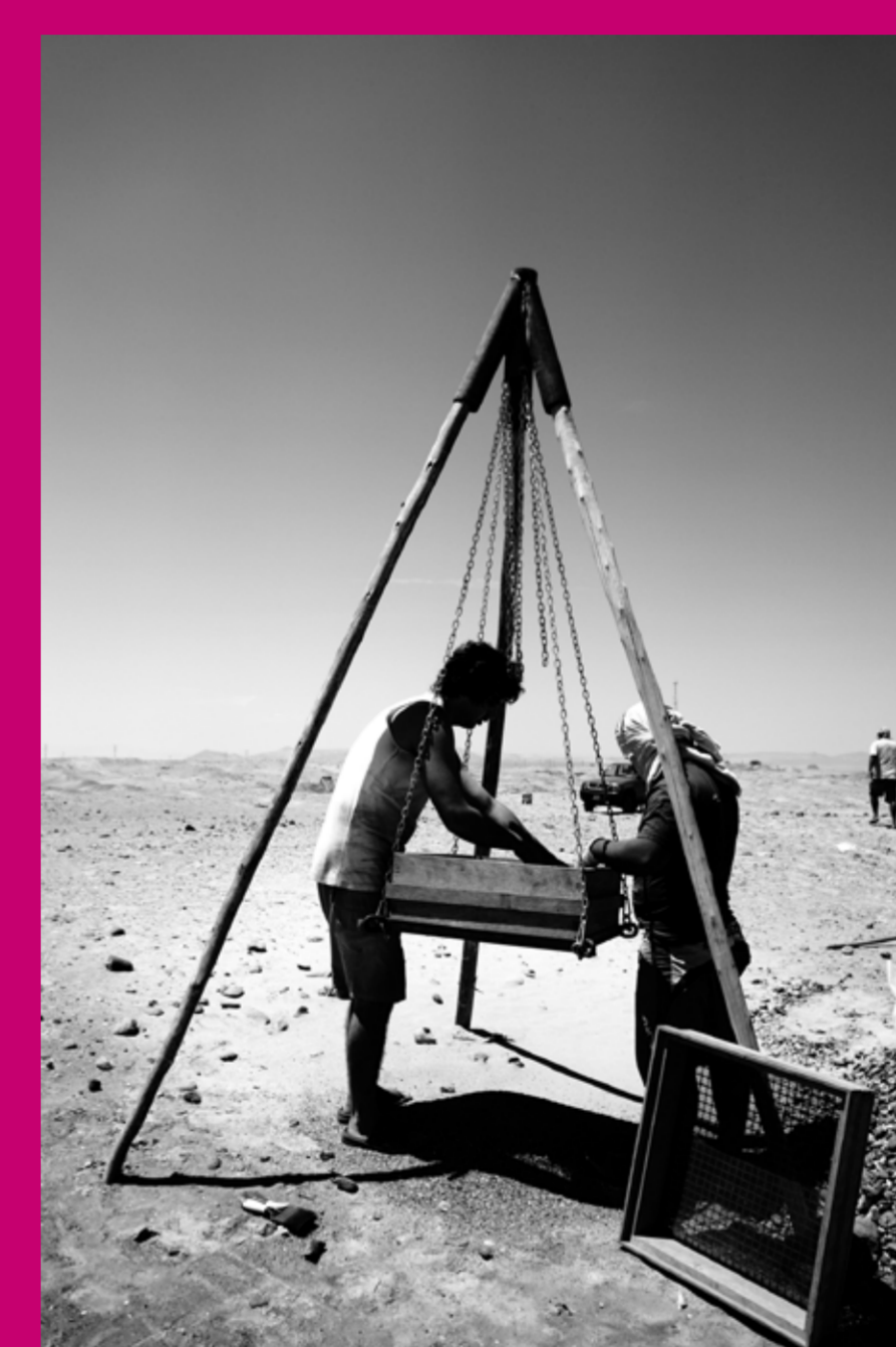
Tamizado en seco de todos los materiales excavados para recuperar restos de flora y fauna consumidos por los antiguos pobladores de Puerto Nuevo.