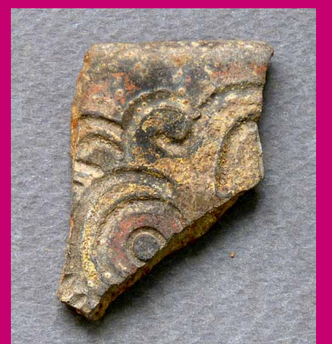
Fragmento de un cuenco de cerámica decorado en un estilo típico de la costa norte (Cabeza de águila arpía. Técnica de incisiones gruesas y pintura post cocción en zonas).