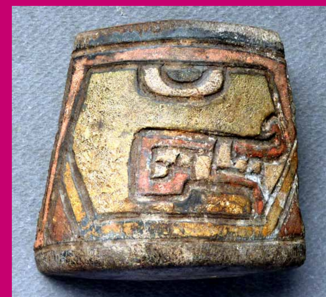
Fragmento de un cuenco de cerámica decorado en un estilo típico de la costa norte (Caras felínicas de perfil inscritas en hexágonos entrelazados. Técnica de incisiones gruesas y pintura post cocción en zonas).