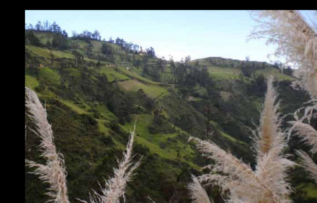
Camino a Jangalá desde San Miguel de Pallaques.

Por ejemplo, en la ciudad de San Miguel de Pallaques, luego de varias entrevistas, pudimos seleccionar el área adecuada para concentrar nuestra atención: el caserío de Jangalá (a media hora a pie), donde se practican dos técnicas alfareras y el tejido se hace al modo rural tradicional.