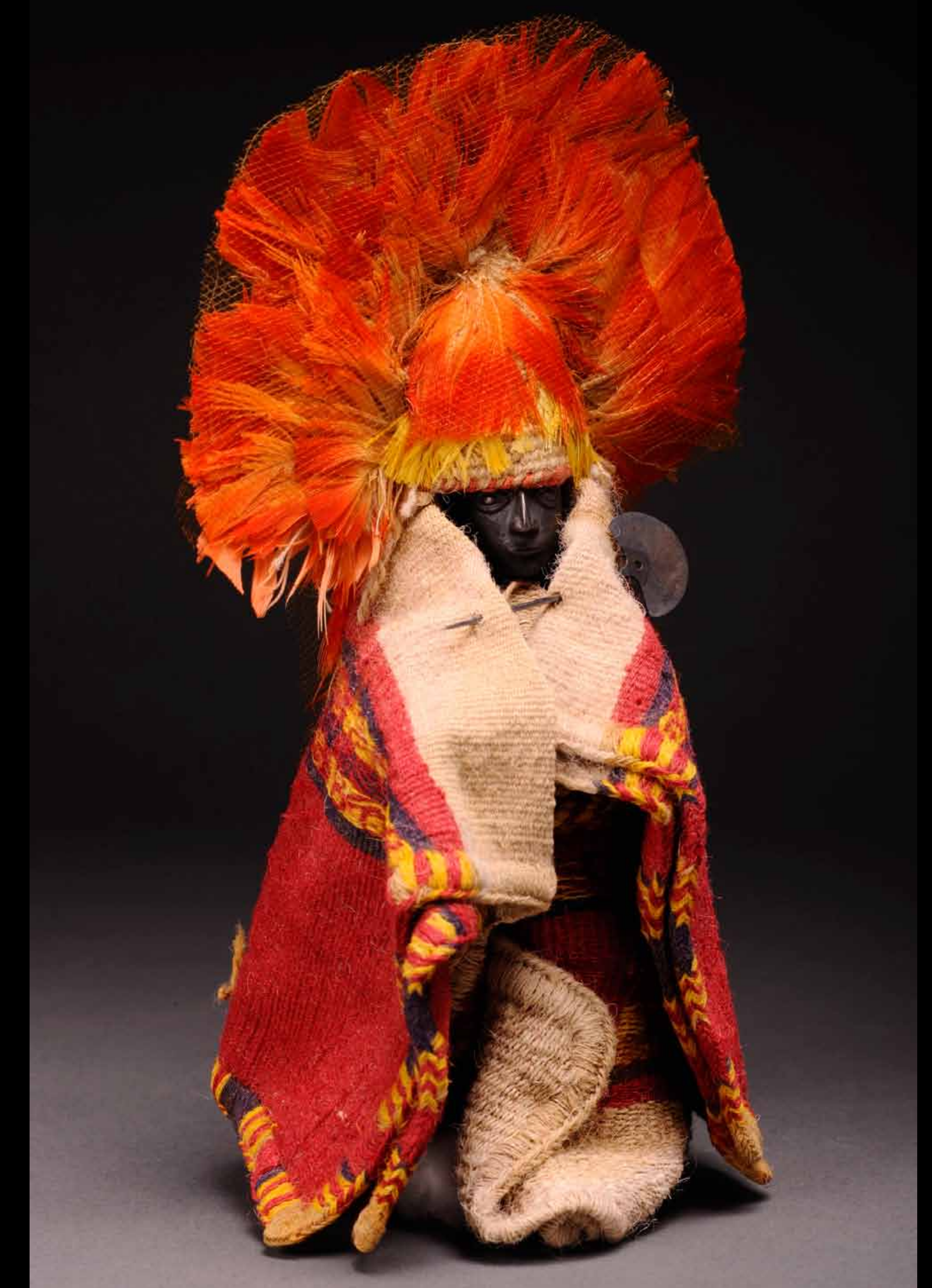
La foto muestra una figurina de plata vestida encontrada en un pozo de ofrendas de un templo incaico de Túcume, costa norte del Perú. Otras parecidas fueron halladas en Lullacollo (Argentina), acompañando a niños sacrificados a modo de capacocha. Semejantes objetos jugaron papeles importantes en el Cuzco incaico como se sabe de crónicas tempranas como la de Betanzos (1551). Este tipo de contextos muestra la utilidad de la arqueología para la interpretación de rituales en el Perú Antiguo.