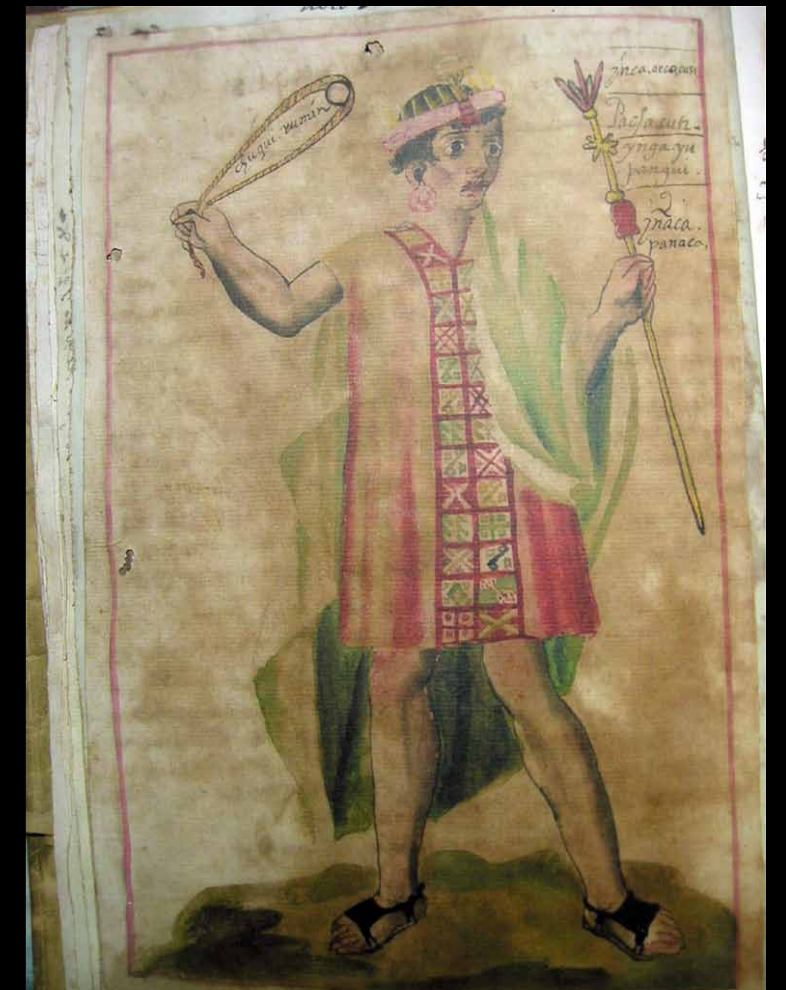
Fray Martín de Murúa escribió la Historia General del Perú, en la que incluyó muchas ilustraciones. Esta es su representación del Inca Pachacútec.

El programa de Investigación sobre el Estudio de las Categorías Andinas ha ganado tres proyectos de Investigación en la PUCP. Se ha realizado ya una primera etapa, gracias a dos proyectos financiados por el Vicerrectorado de Investigación de la Universidad con el estudio de la valiosa Summa y Narración de los Incas de Juan Diez de Betanzos. Asimismo, se está trabajando ahora la Relación de las Fábulas y Ritos de los Incas. El programa incluye un equipo interdisciplinario integrado por lingüistas, arqueólogos, e historiadores el mismo que trabaja de manera permanente en el mejor entendimiento de la historia andina del Perú.