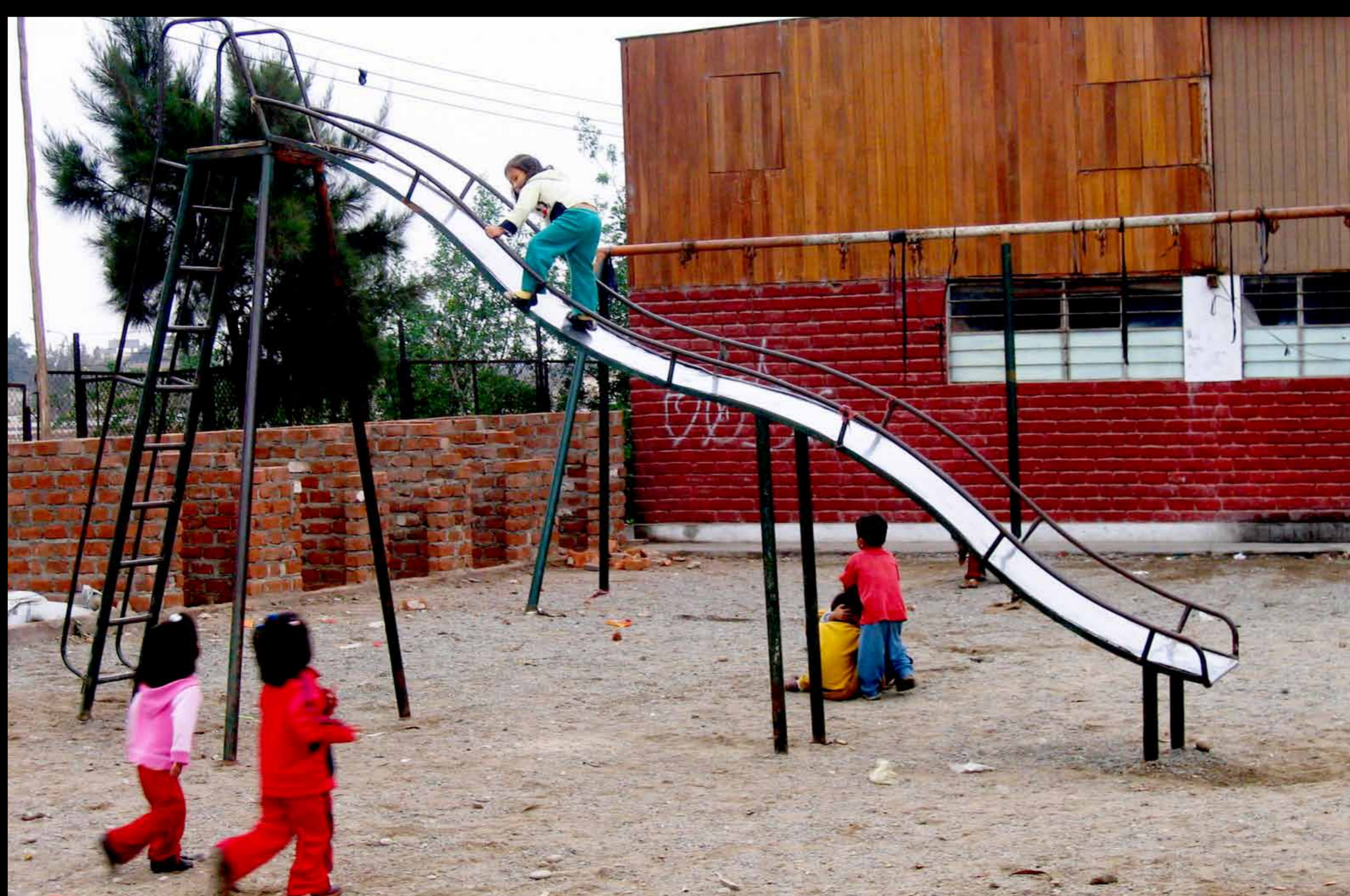
Escuela de Cantagallo.