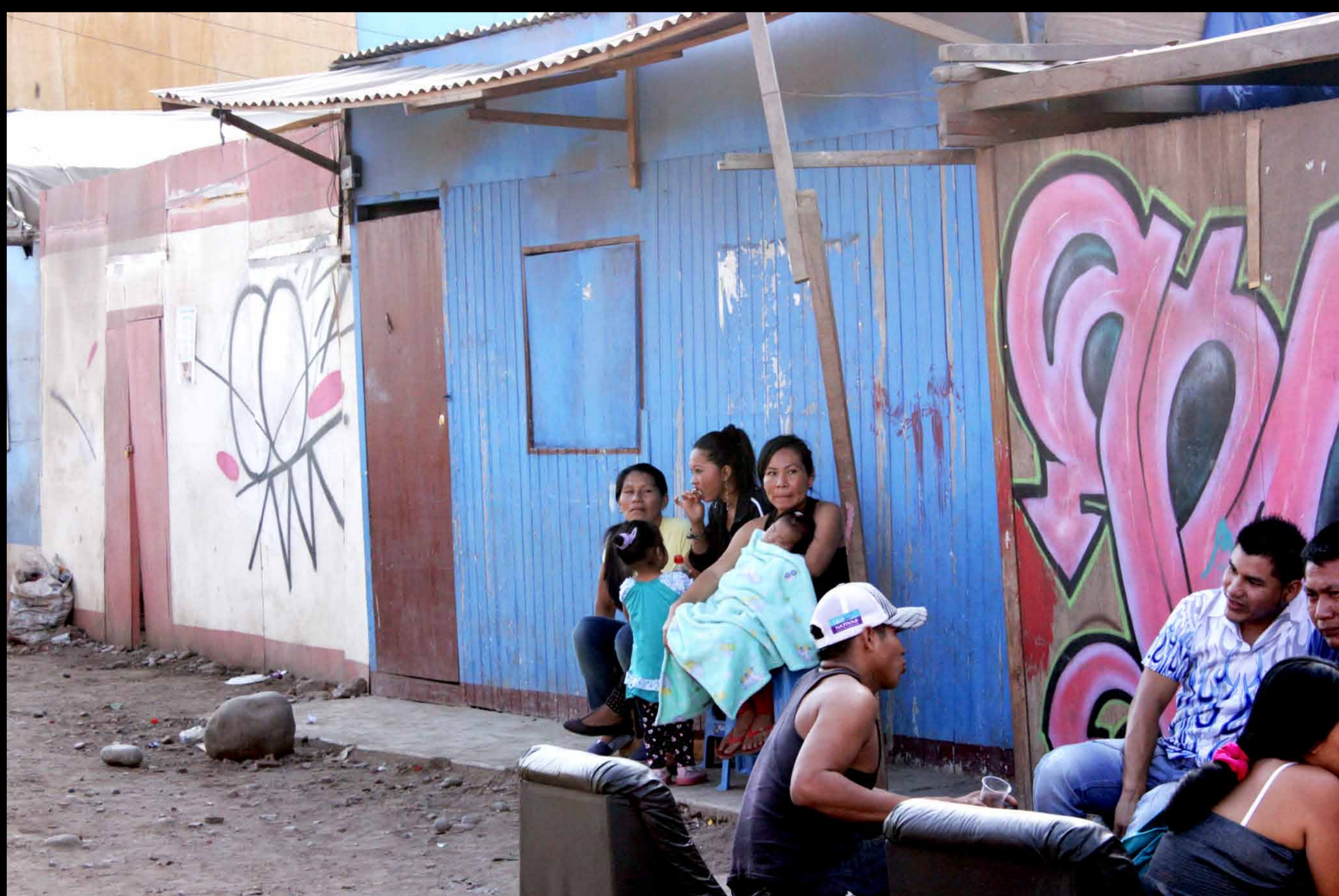
Vecinos shipibos de Cantagallo.