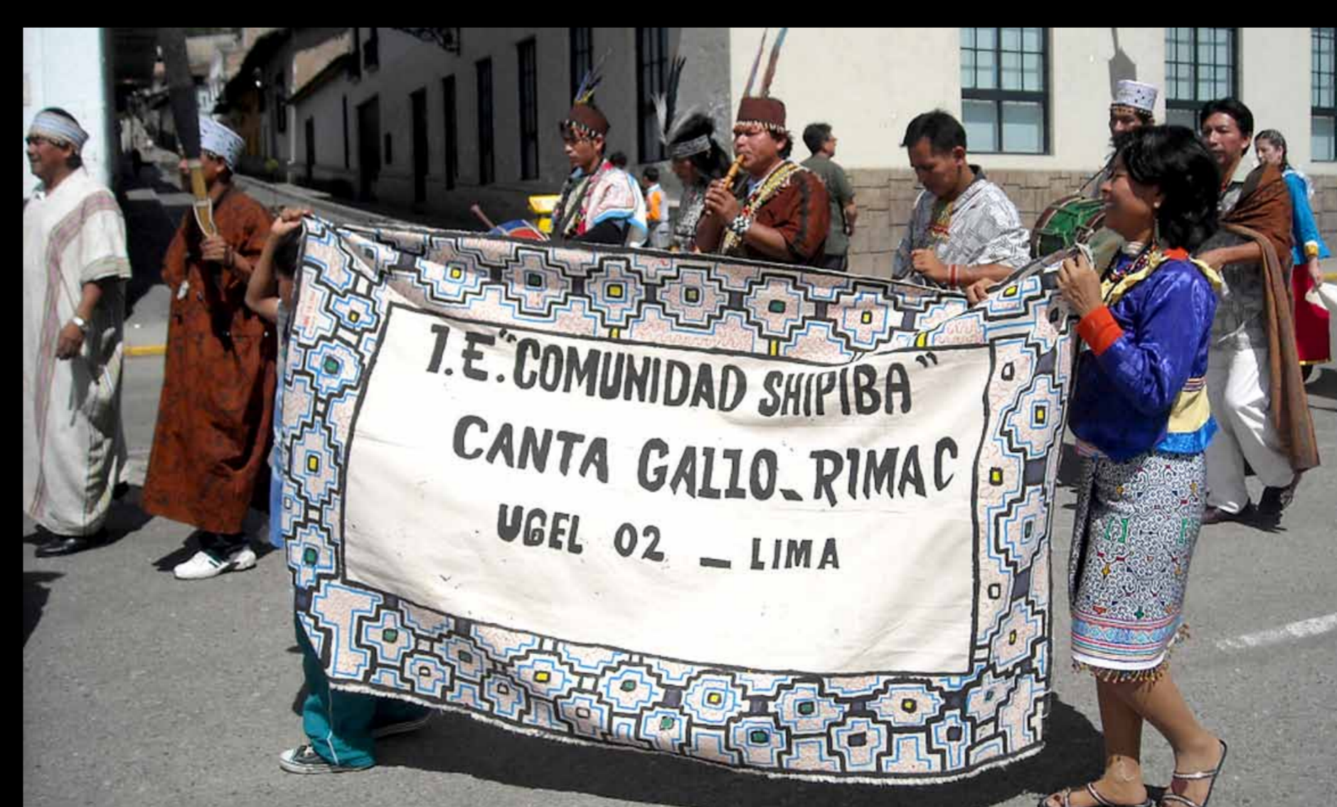
Cantagallo por la Educación Intercultural Bilingüe.