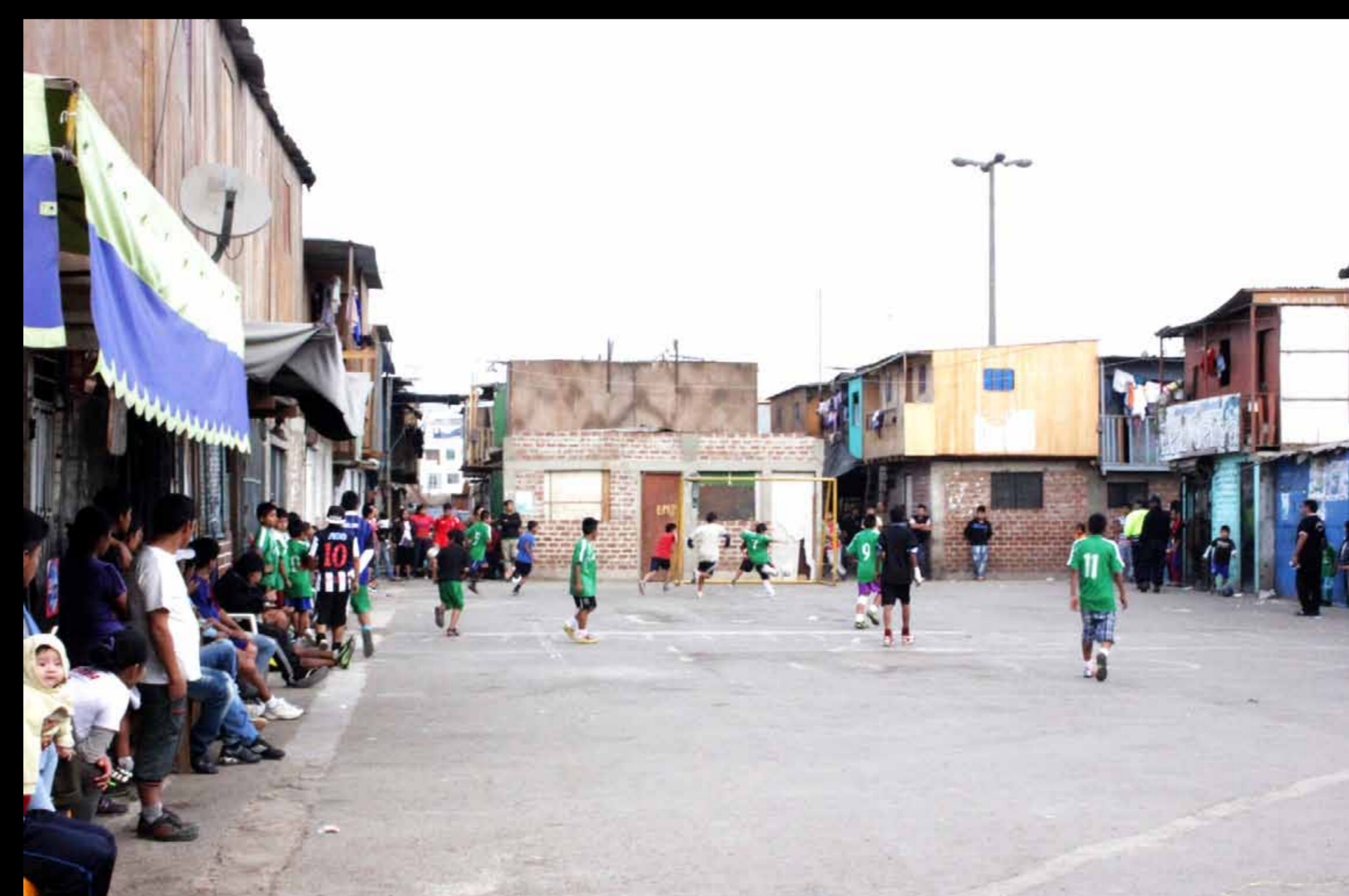
Cantagallo – Cancha de fulbito.