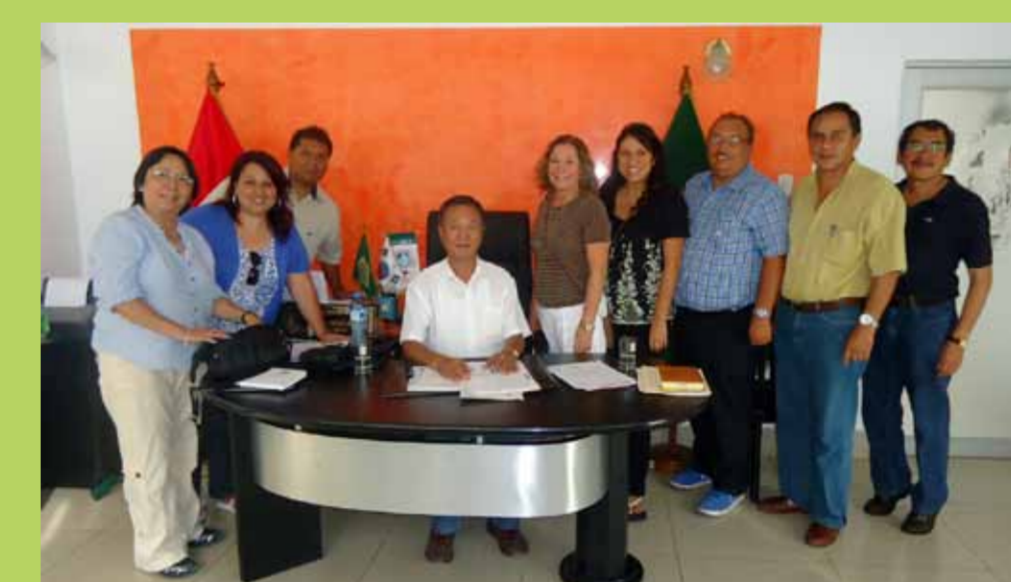
Reunión con Alcalde Municipalidad Chanchamayo.