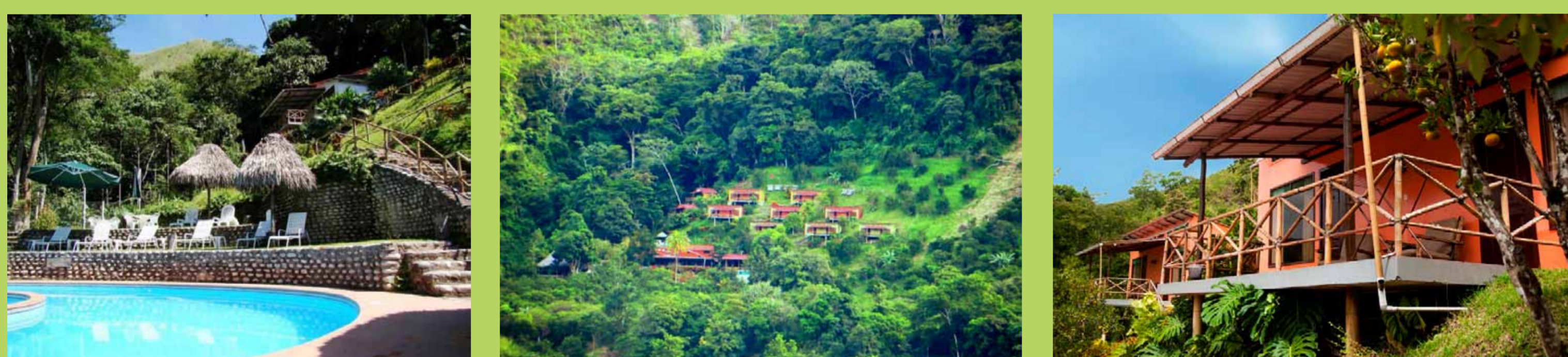
Fundo San José.

Además del producto ecoturístico, que incluye cuatro nuevos programas turísticos dentro del fundo basados en el Centro de Interpretación y el Sendero Interactivo con un Aplicativo para Smartphone y Audio Guías, se entregará un Inventario de Especies en el Bosque Primario Protegido en la Provincia de Chanchamayo por método de muestreo, y un Módulo Piloto de un Centro de Interpretación Interactivo y un Sendero Piloto para mostrar la biodiversidad de Flora y Fauna del Bosque Primario Protegido en la Provincia.