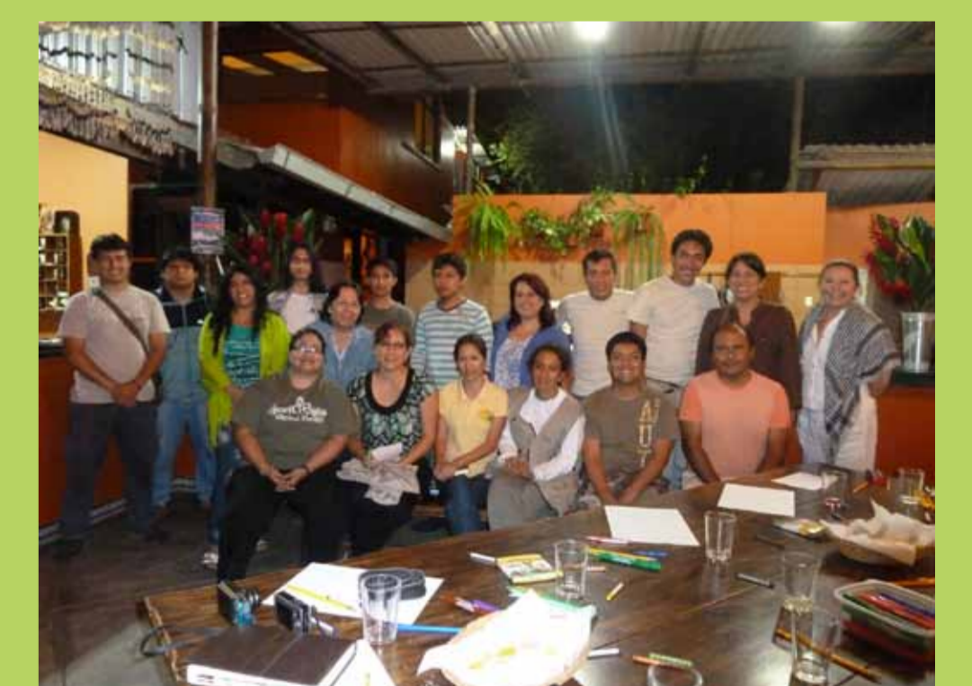
Guías locales, equipo de biólogos y equipo técnico del proyecto.