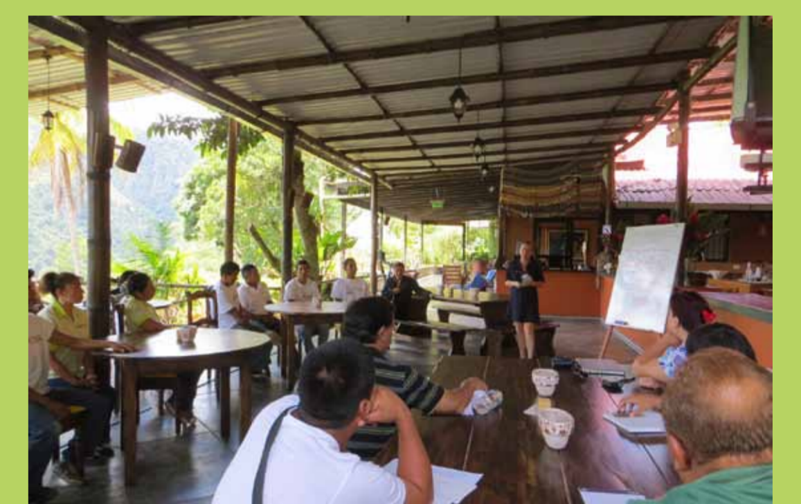
Presentación PIPEI en San José.