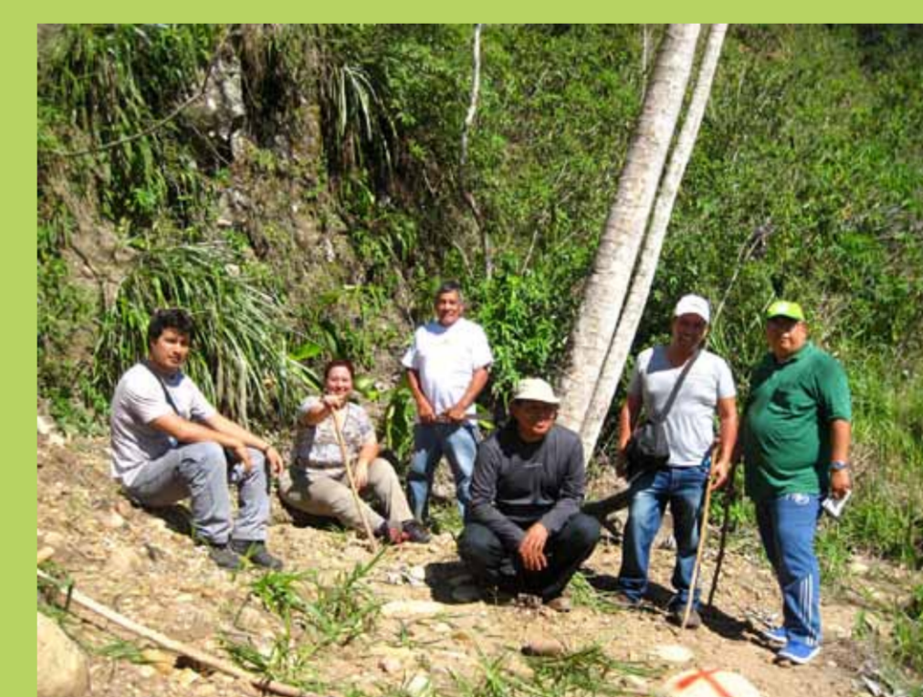
Recorrido de sendero en SJ, equipo técnico.