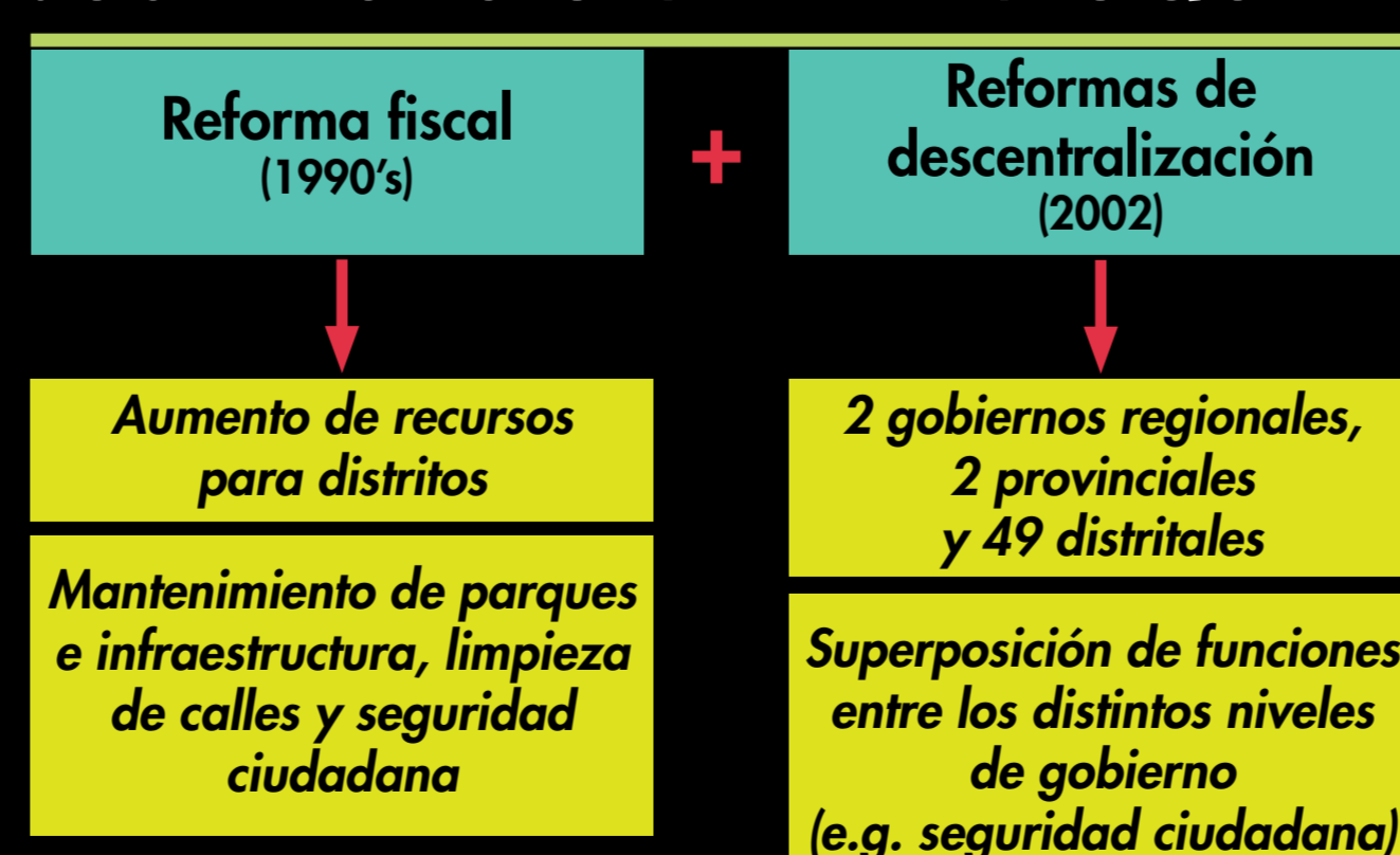
GRÁFICO 2 JUSTIFICACIÓN DEL ENFOQUE

Distritos de estudio: Rímac, San Miguel y Miraflores