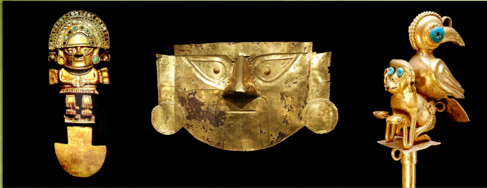
Objetos de oro emblemáticos de la Civilización Lambayeque