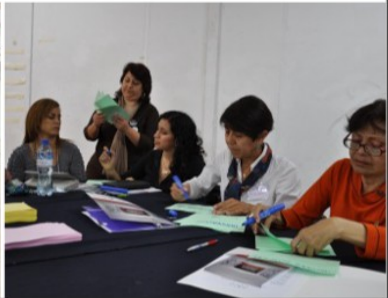
Mesa de diseñadores