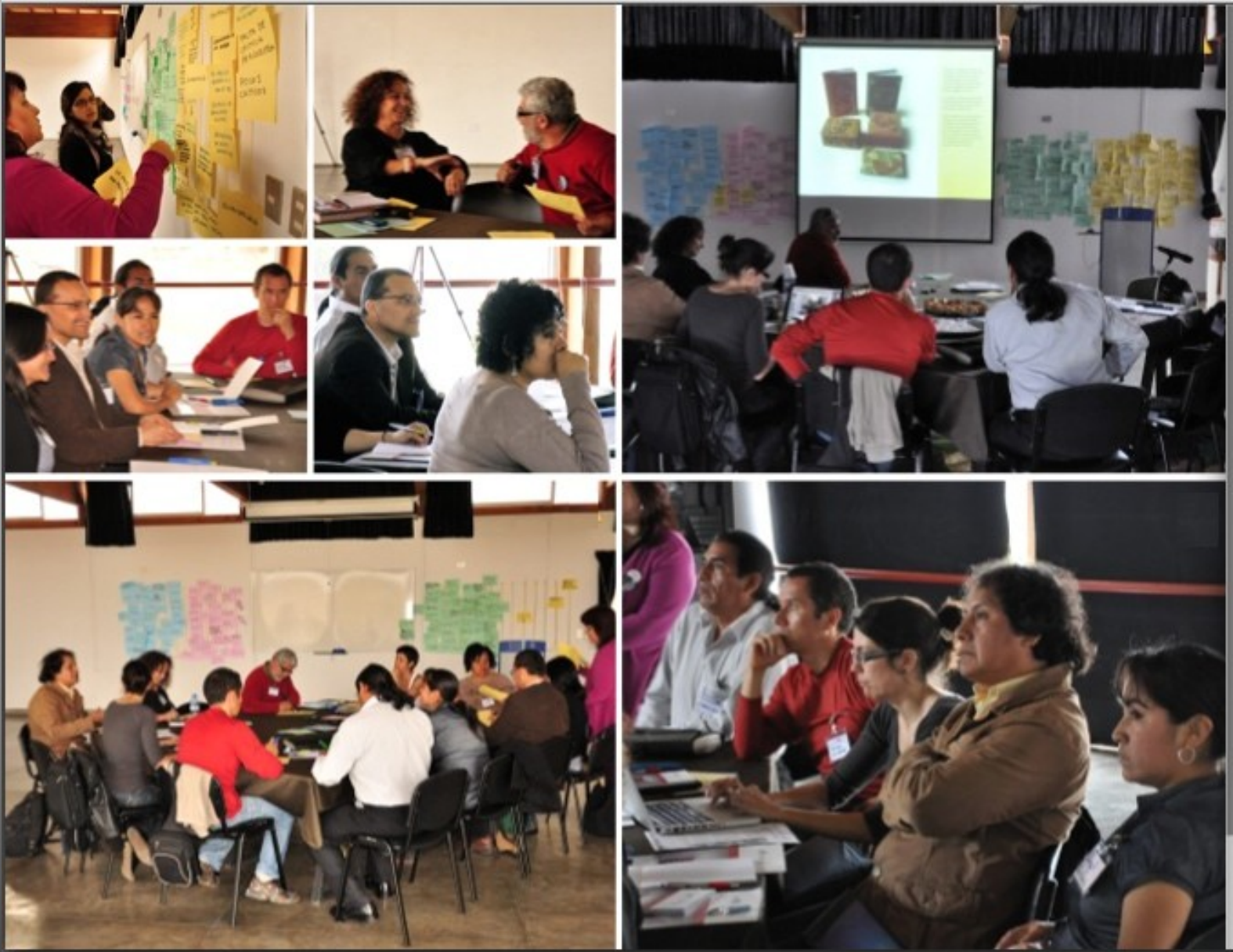
Mesa de artistas