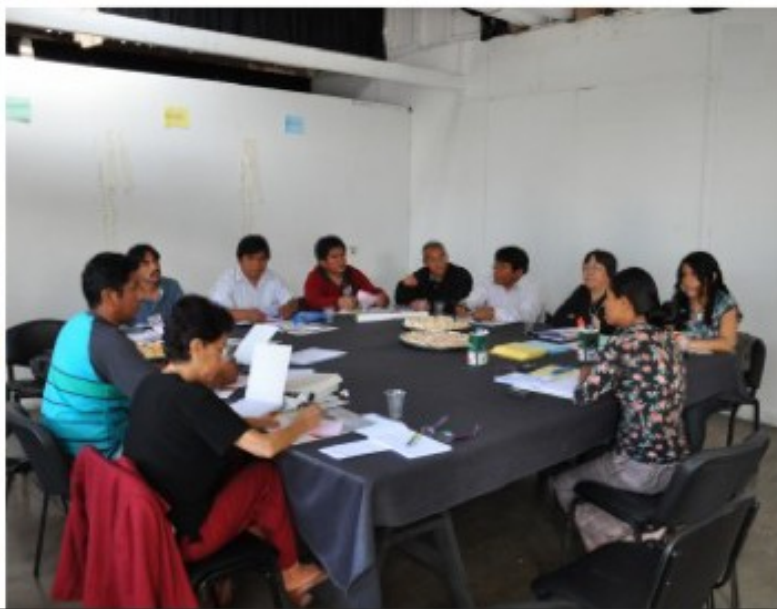
Mesa de artesanos