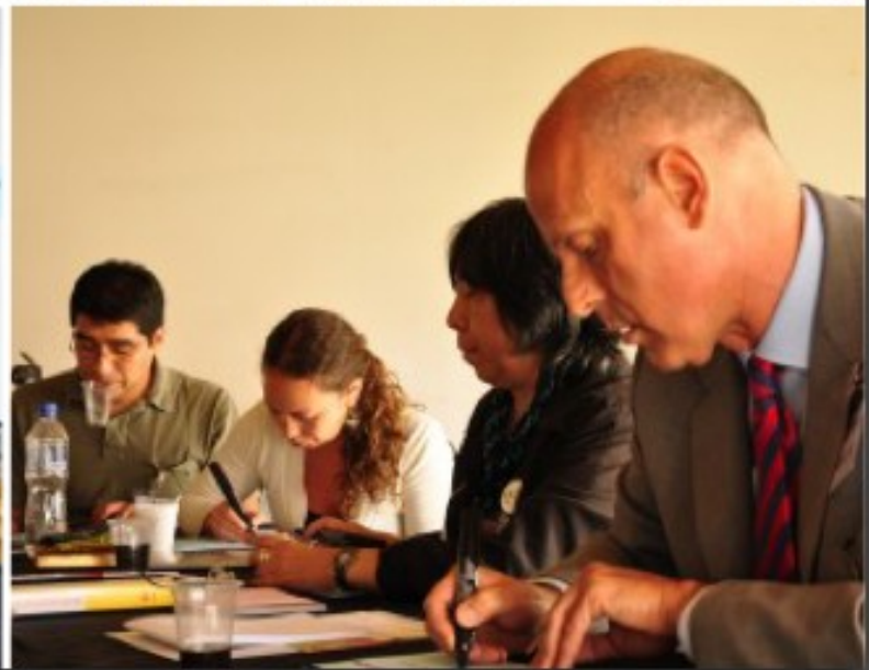
Mesa de especialistas