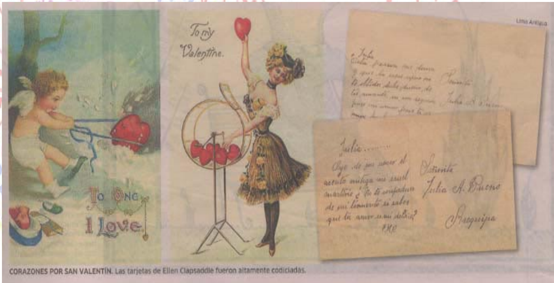
CORAZONES POR SAN VALENTÍN. Las tarjetas de Ellen Clapsaddle fueron altamente codiciadas.