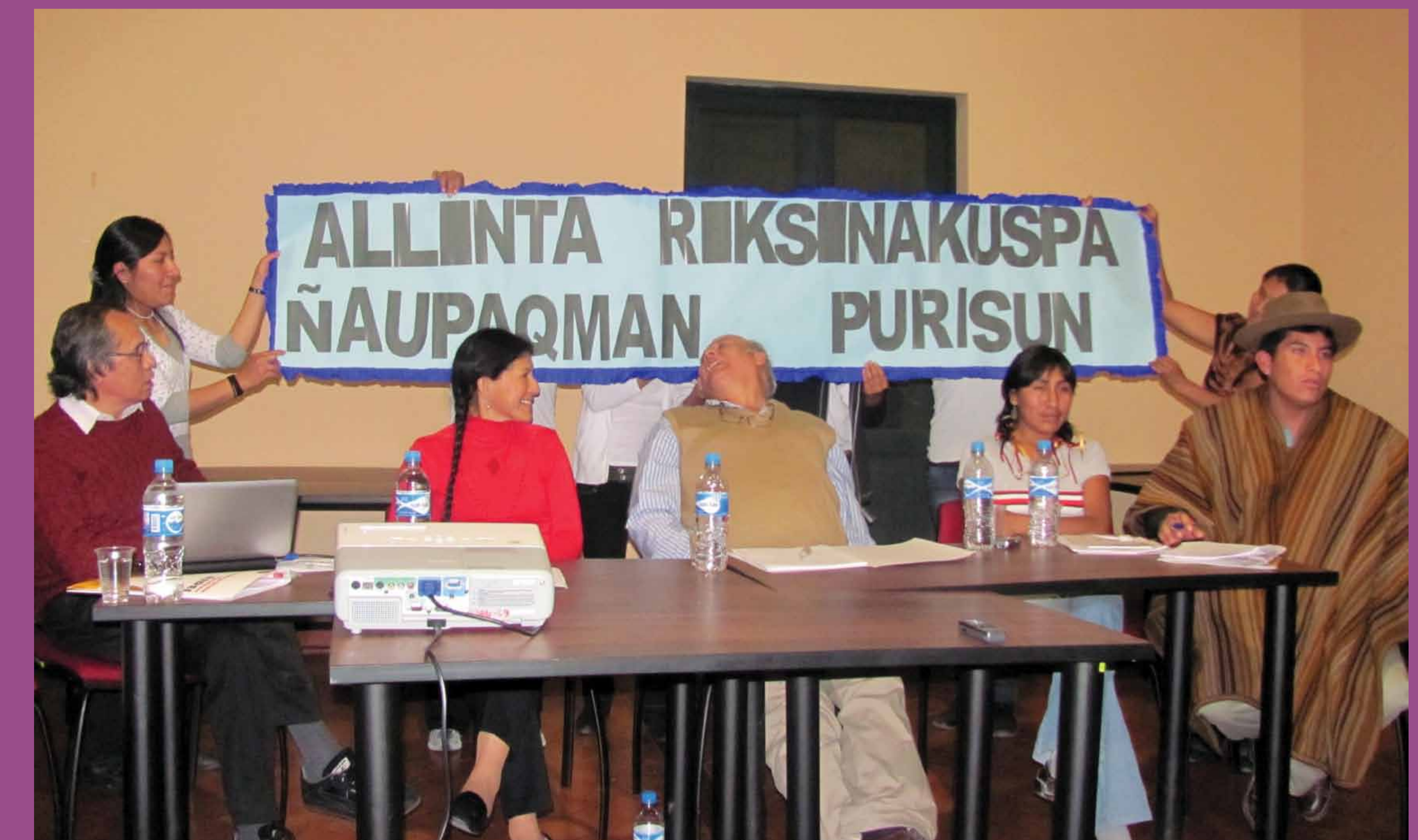
Conversatorio en Ayacucho: "Para ser ciudadanos y no ser discriminados. Socialización y debate de un proceso de interaprendizaje"