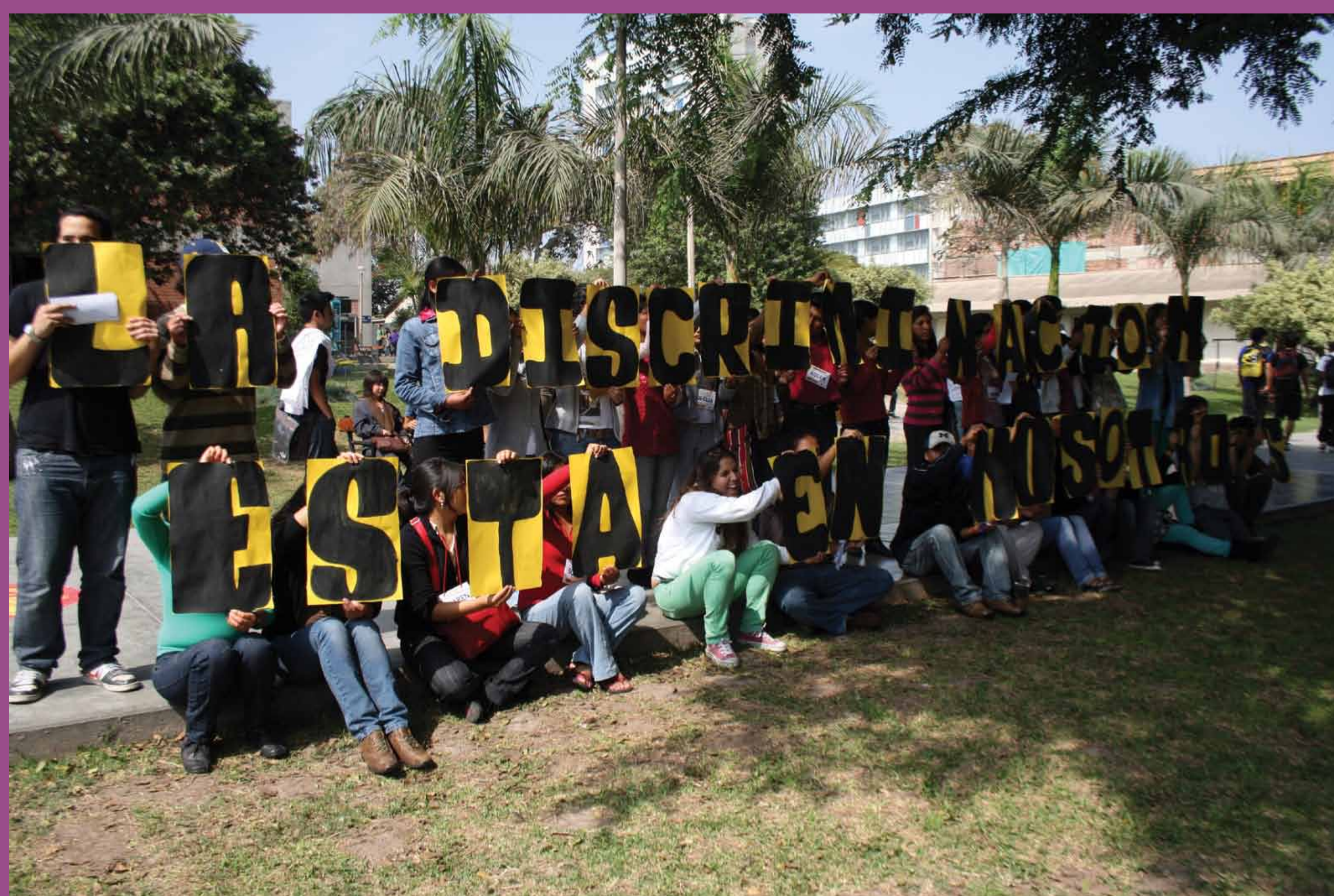
Intervención de sensibilización en el campus de la PUCP "La discriminación esta en nosotros. ¡Reaccional!"