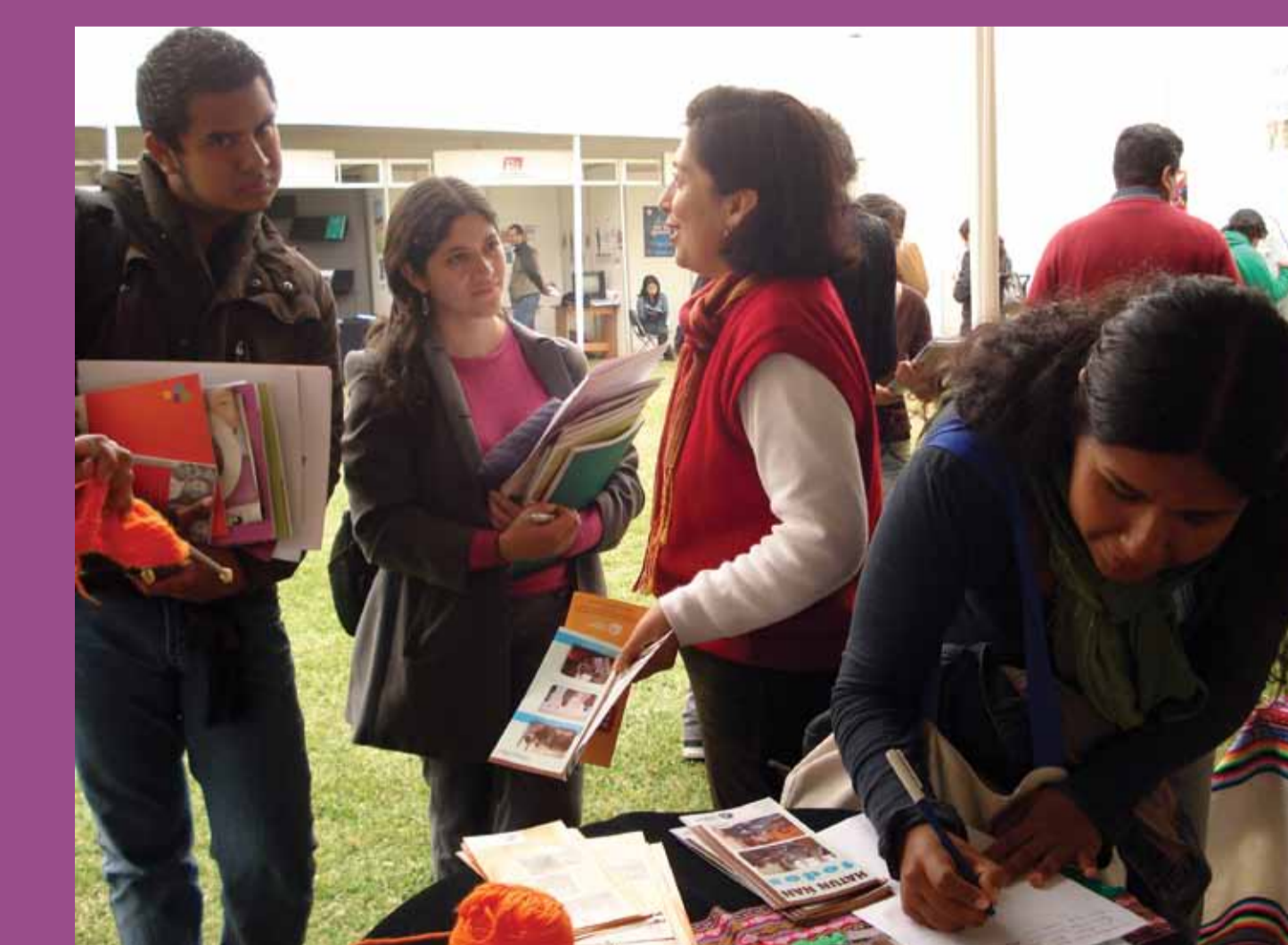
Feria "Diversidad Cultural y Derechos Humanos"