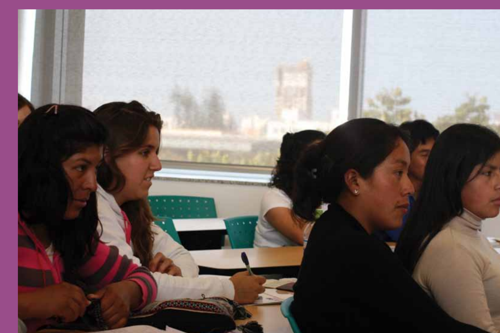
I Foro interuniversitario "La universidad y el reconocimiento positivo de la diversidad cultural" con estudiantes del programa Hatun Ñan de la UNSCH-UNSAAC-PUCP