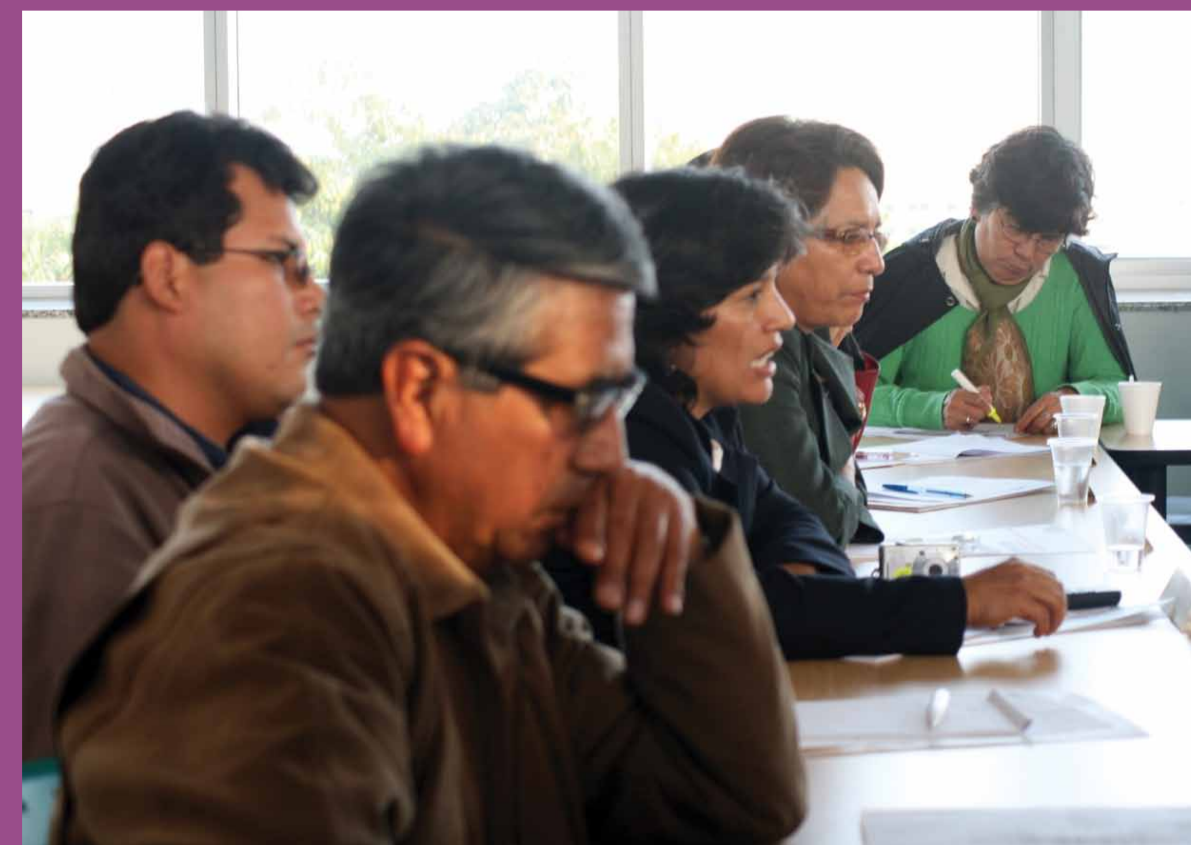
Docentes de las Universidades Nacionales de Ayacucho y Cusco junto con el equipo RIDEI PUCP desarrollan la investigación: "Caminos de interculturalidad. Los estudiantes originarios en la universidad"