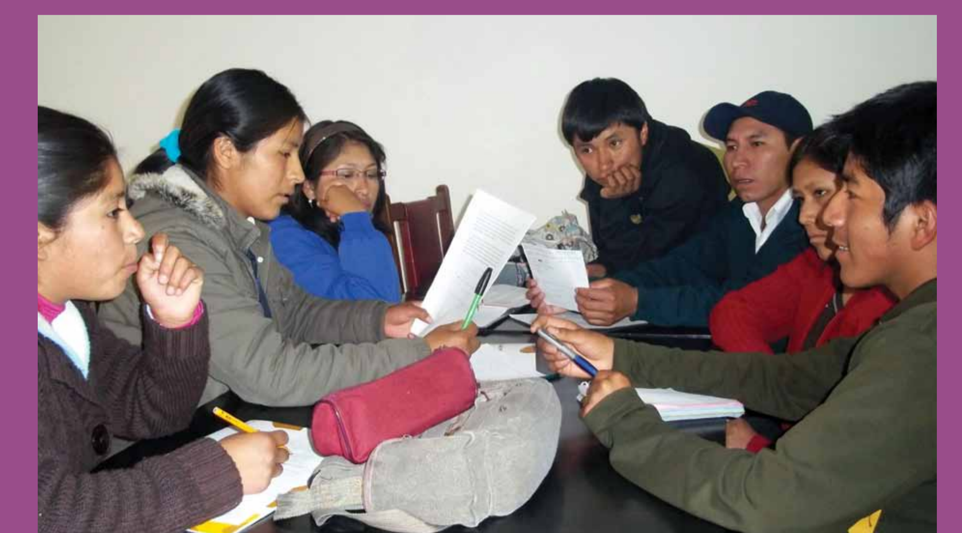
Estudiantes de la Universidad Nacional San Antonio de Abad del Cusco - Taller de ciudadanía intercultural