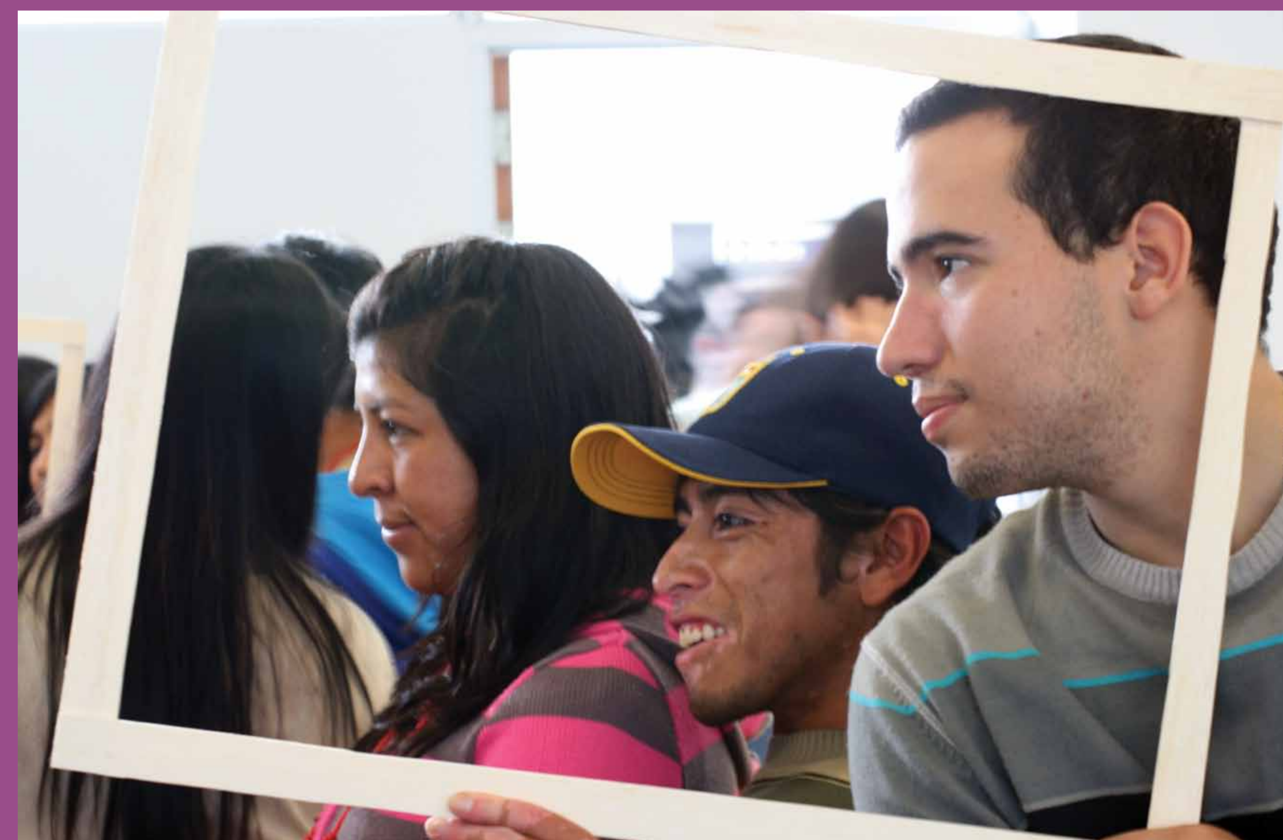
Preparativos para la intervención en el campus de la PUCP "La discriminación esta en nosotros. ¡Reaccional!"

El RIDEI-PUCP organiza su quehacer en redes y alianzas institucionales que facilitan el desarrollo de proyectos y actividades orientadas a promover cambios dirigidos a construir una sociedad más justa en la que la convivencia se alimente del aprendizaje mutuo y sin prejuicios entre grupos y personas de orígenes sociales y culturales diferentes.