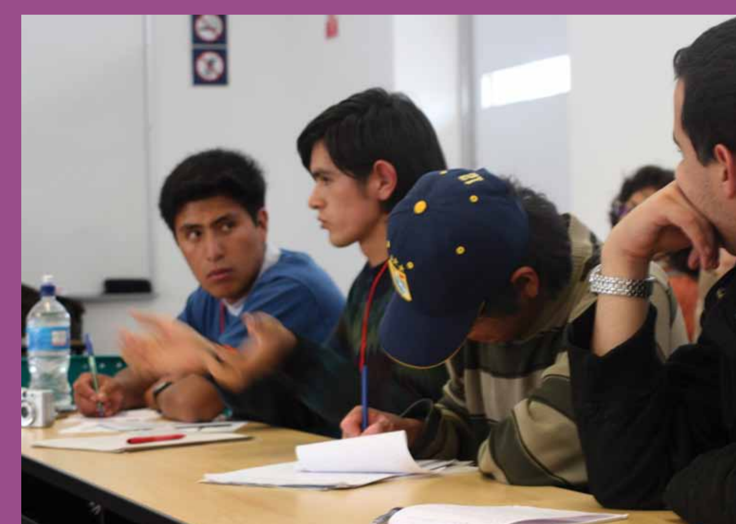
Taller de ciudadanía y discriminación con estudiantes de las Universidades Nacionales de Ayacucho, Cusco y de la PUCP