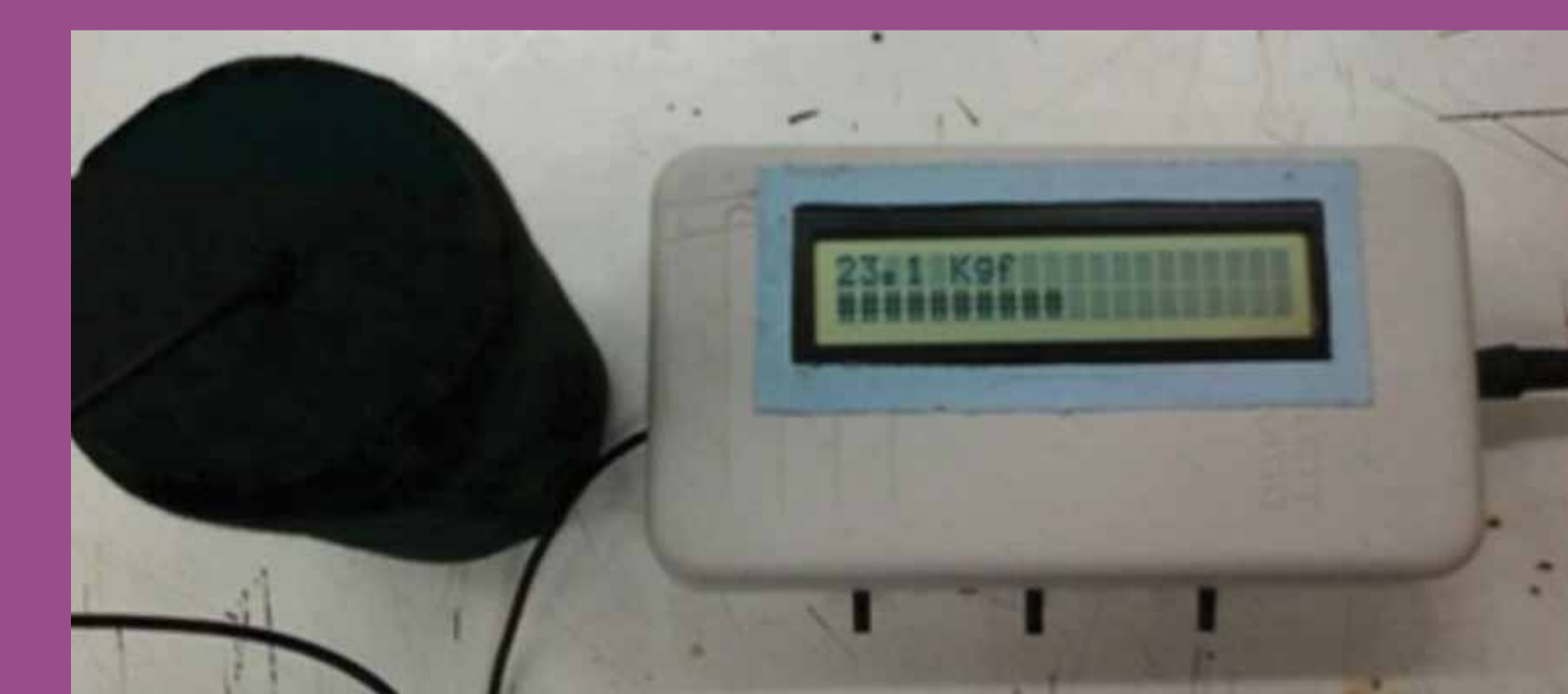
Prototipo de Dinamómetro Geriátrico

El presente prototipo de dinamómetro geriátrico consiste en un dispositivo digital de bajo costo que puede obtener medidas de fuerza (en kilogramos-fuerza) mediante la presión manual de un módulo sensor por parte del paciente. La fuerza es medida en tiempo real y se visualiza, ya sea en la pantalla del artefacto, o bien en una computadora a través de un software de aplicación diseñado para comunicarse con el instrumento. Cada ensayo tiene una duración máxima de 10 segundos.