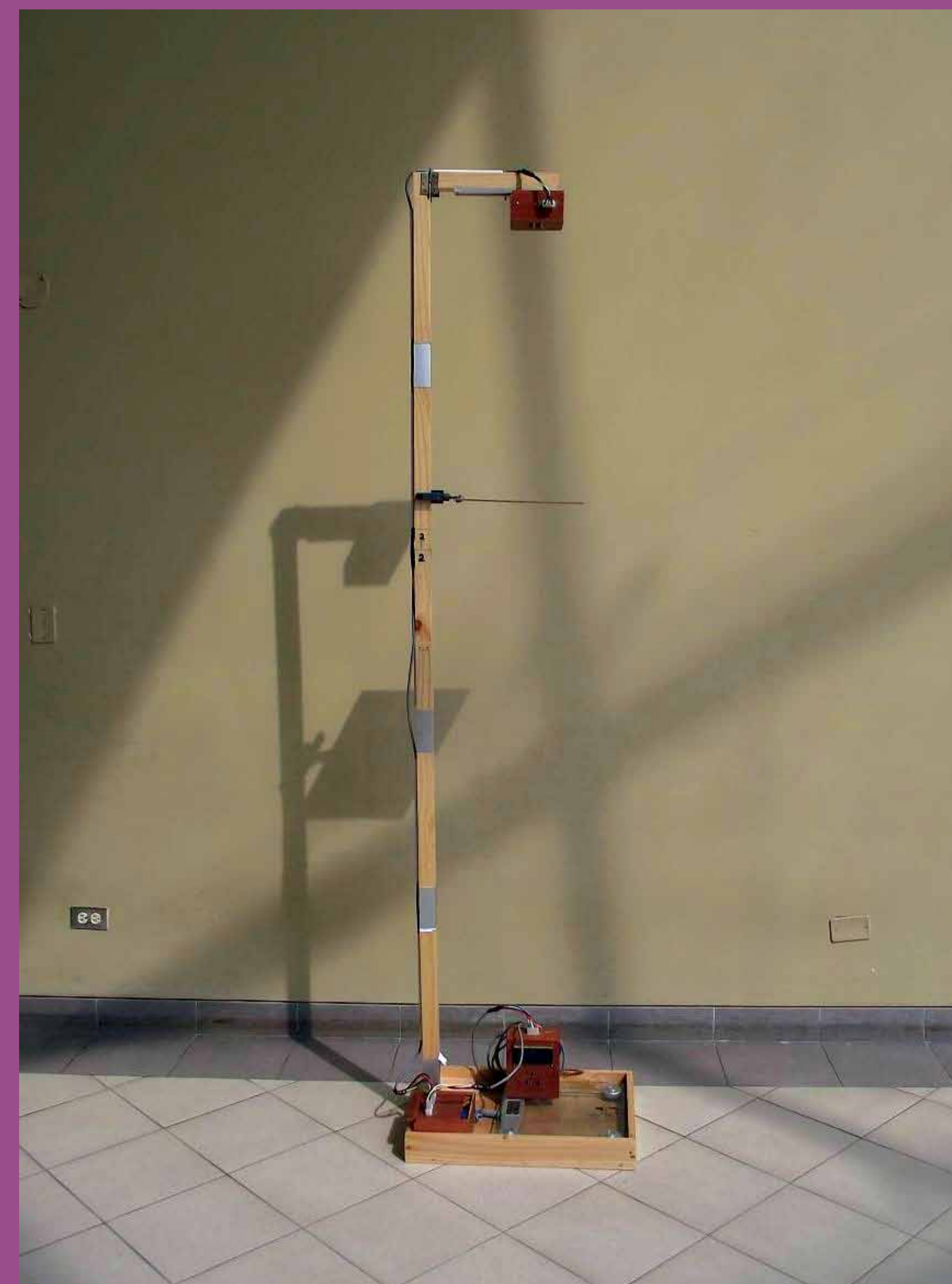
Módulo medidor de Talla y Peso

El presente prototipo consiste en un dispositivo que permite calcular el valor de peso y altura de una determinada persona. Debido a su aplicación en zonas rurales, este equipo es portátil y fácil de transportar. Así mismo, se puede tener un registro de hasta 1000 pacientes con su respectiva talla y peso que es almacenado en una memoria USB. El equipo puede calibrarse semi-automáticamente y el tiempo empleado para medición por persona no es mayor a un minuto.