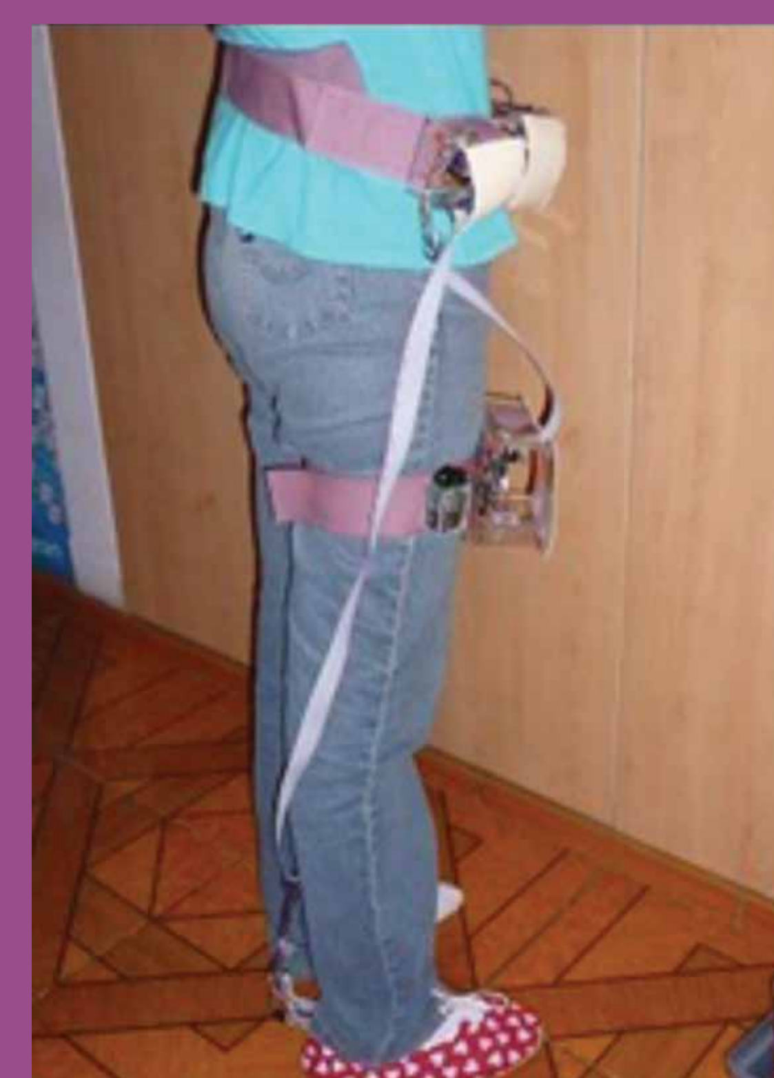
Plantilla para pie diabético

El prototipo presentado consiste en una plantilla de sensores que sirve para identificar las regiones con riesgo de ruptura de la piel. La plantilla captura los datos de presión y estos se muestran, a través de un software dedicado, en una computadora. Aquí el médico especialista puede ver un esquema donde se muestra el pie del paciente y los puntos de presión descritos por indicadores de color. De esta forma puede identificar fácilmente en qué puntos del pie se está generando más presión y así iniciar el respectivo tratamiento preventivo.