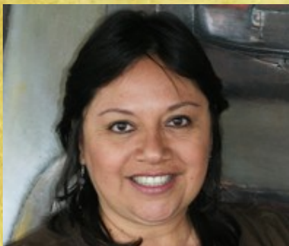
Gabriela Ayzanoa Asesora Nacional de Comunicaciones