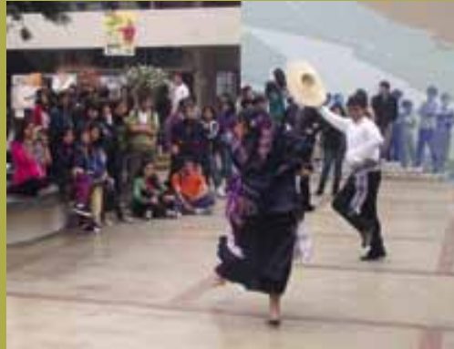
Celebraci3n dıa de la canci3n criolla