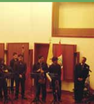
tal didáctico ca - 15 al 18 de noviembre