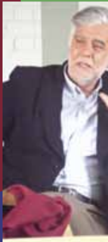
La vocaci3n del escri Feria Vocacional -