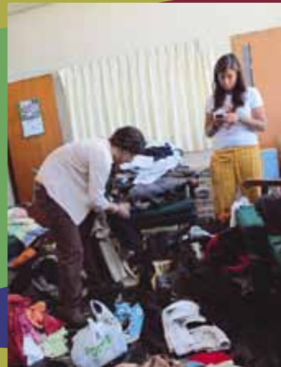
Miembros del grupo Yamino preparando donaciones para Ucayali 14 al 28 de marzo