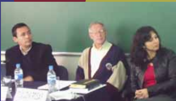
Presentaci3n de programas interdisciplinarios