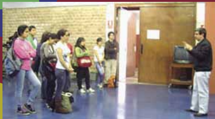
Visita facultad de comunicaciones Feria Vocacional 2 al 11 de noviembre