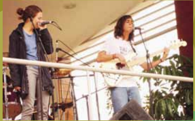
Concierto rađio makonnen para promover Festival Selvãmonos 3