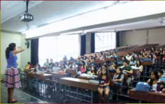
Charla nuevos miembros OPROSAC 17 de marzo 2011