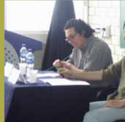
Experiencias de la enseńanza qu