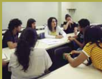
Concurso de proyectos - recibiendo asesorıa