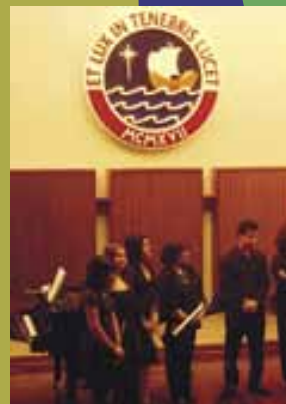
Reci Semana de la mısica