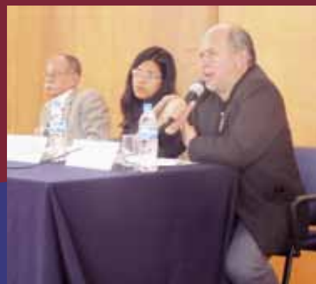
Conversatorio El desarrollo sostenible