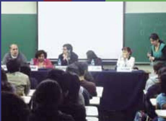
Charla con 5 especialidades comunica2 Feria Vocacional