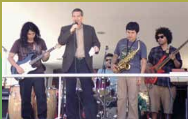
Concierto de música popular Semana de la música - 15 al 18 noviembre