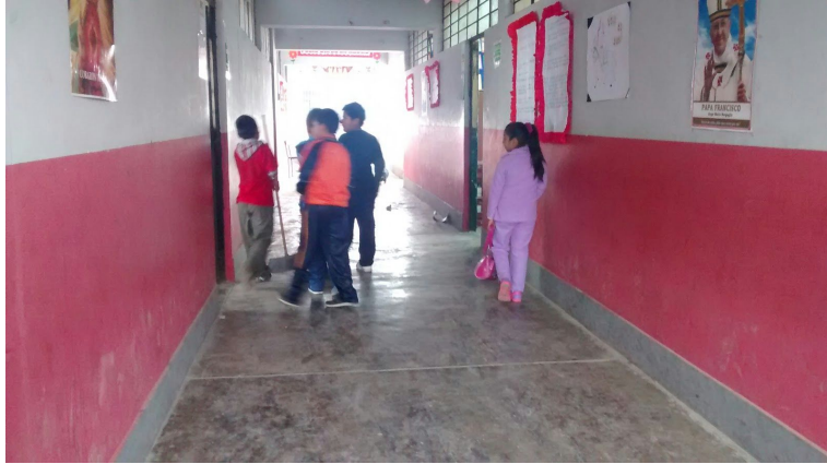
Niños entrando a su clase