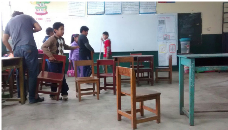
Alumnos y profesor ordenando el aula para sus clases