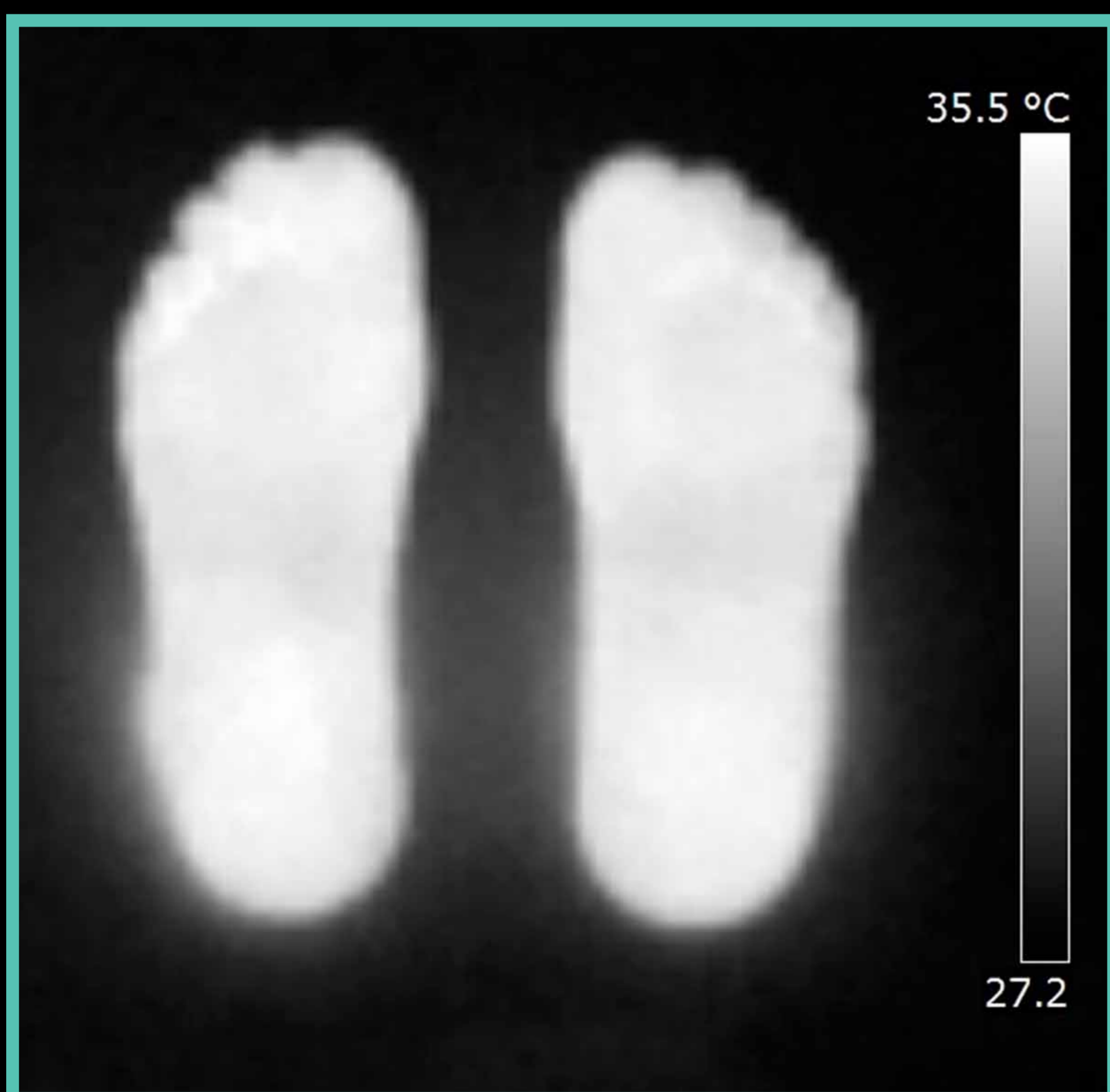
Imagen térmica de la planta de los pies.