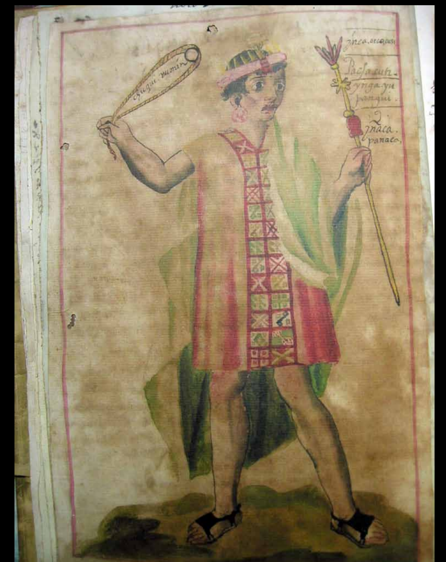
Fray Martín de Murúa escribió la Historia General del Perú, en la que incluyó muchas ilustraciones. Esta es su representación del Inca Pachacútec.