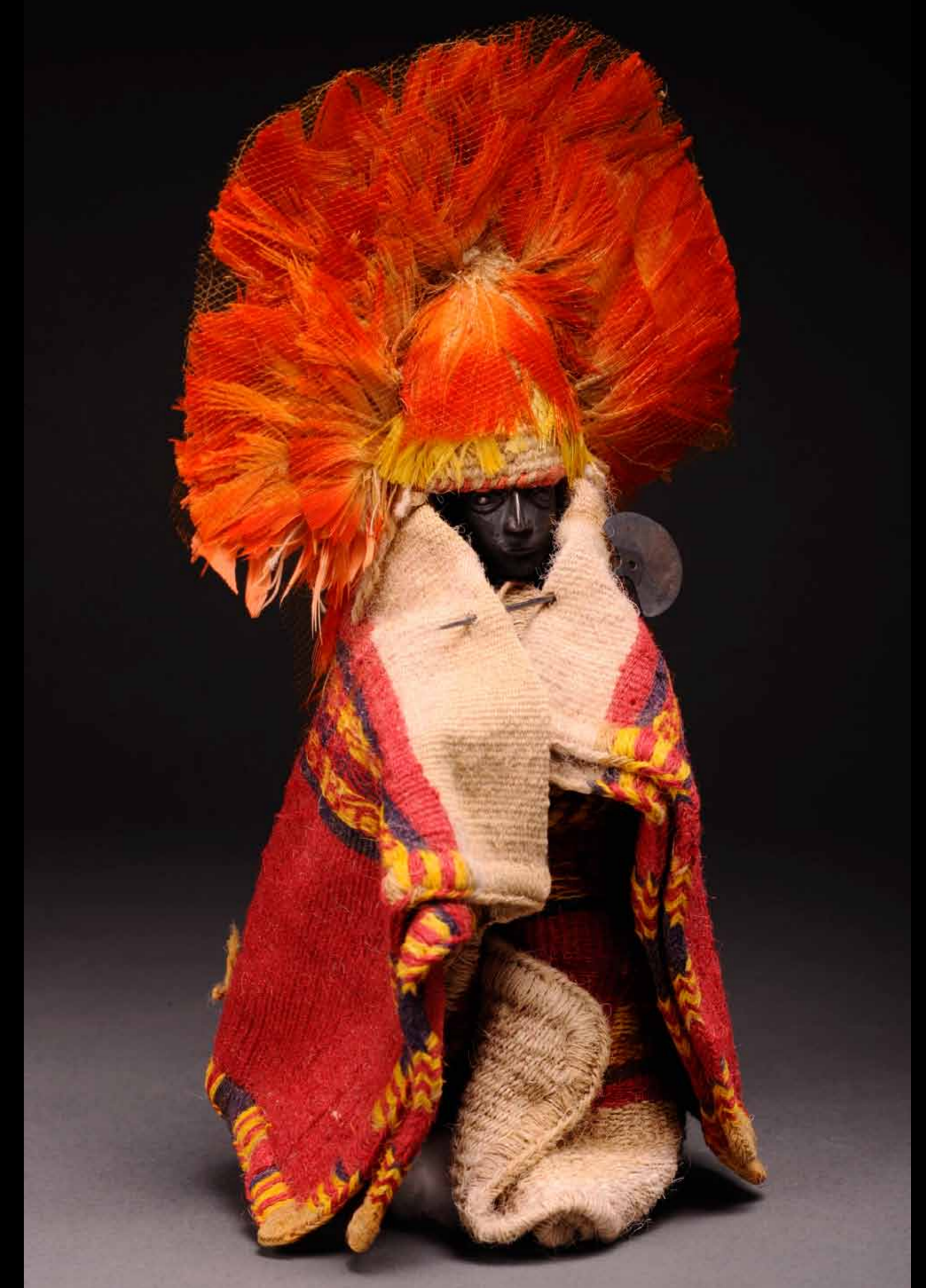
La foto muestra una figurina de plata vestida encontrada en un pozo de ofrendas de un templo incaico de Túcume, costa norte del Perú. Otras parecidas fueron halladas en Lullacollo (Argentina), acompañando a niños sacrificados a modo de capacocha. Semejantes objetos jugaron papeles importantes en el Cuzco incaico como se sabe de crónicas tempranas como la de Betanzos (1551). Este tipo de contextos muestra la utilidad de la arqueología para la interpretación de rituales en el Perú Antiguo.