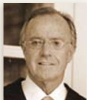
Augusto Ferrero Costa