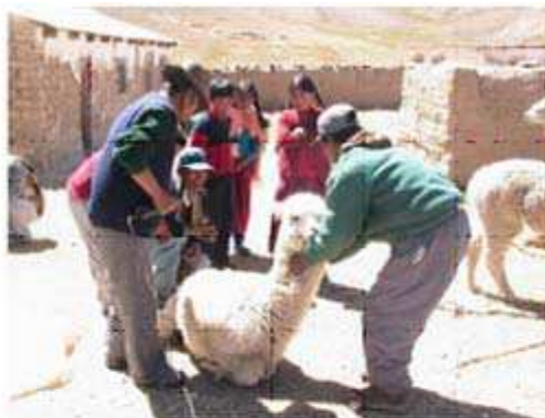
Obtención de la fibra