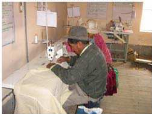
Proceso de la fibra