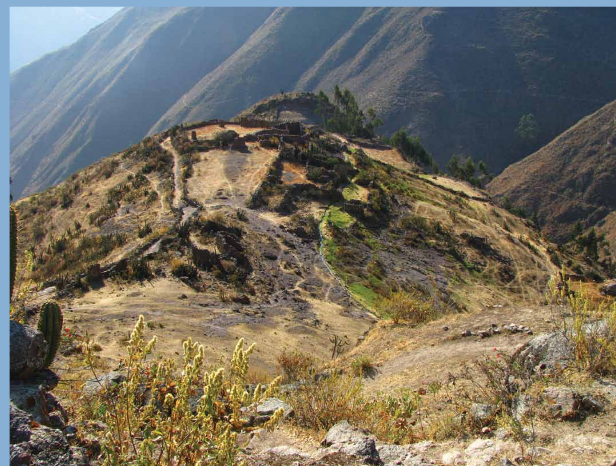
FIG. 2 Vista de sitios de Canchaje distrito de Lahuaytambo.