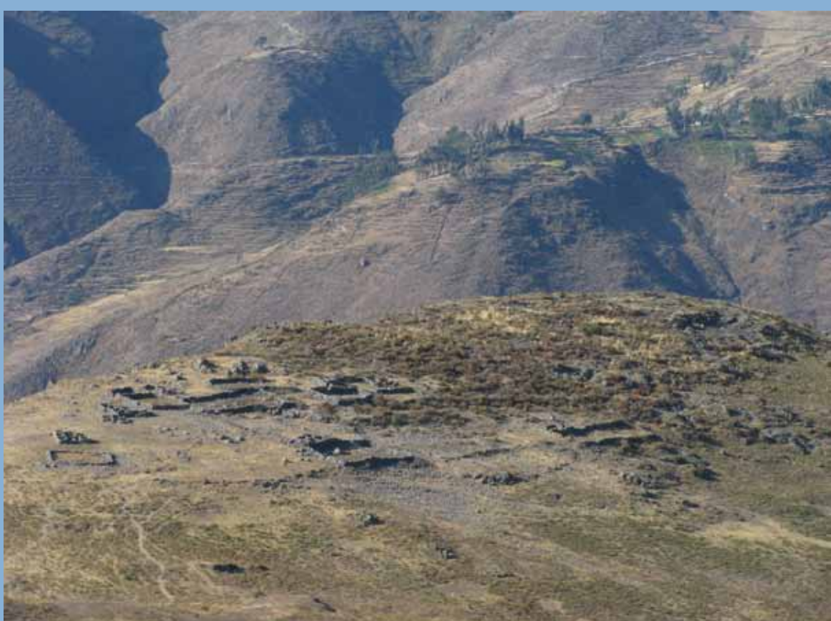
FIG. 3 Sitio de Matahua distrito de Lahuaytambo.