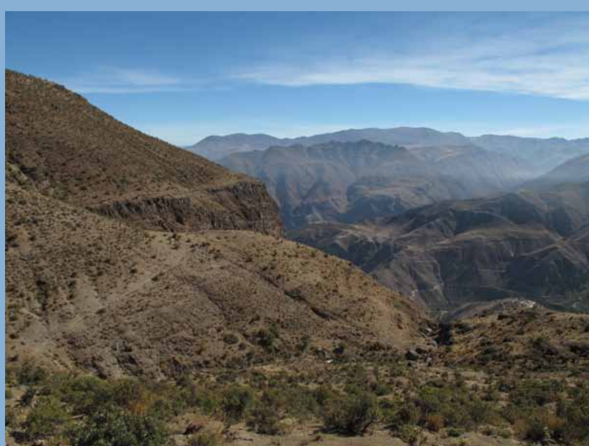
FIG. 1 Área estudiada.