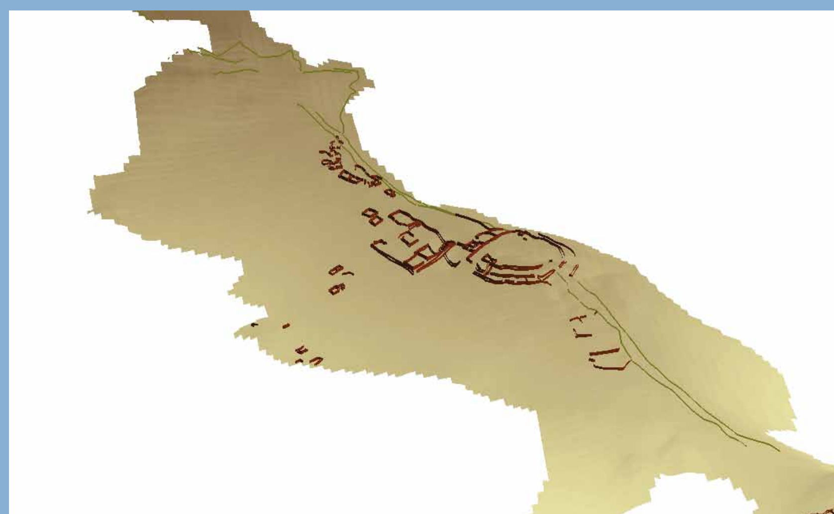
Canchaje vista 3D.