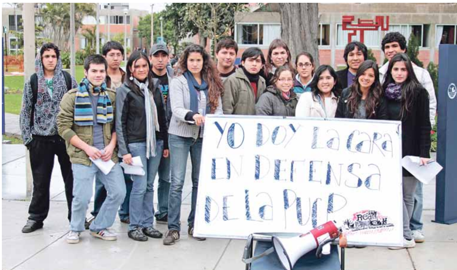
LÍNEA DE DEFENSA. Estudiantes seguirán movilizándose por la autonomía de la PUCP.

El evento, denominado “Yo doy la cara por la PUCP”, fue organizado por la REA (Representantes Estudiantiles ante la Asamblea). Durante tres horas, en el Tontódromo frente al edificio Dintilhac, los organizadores tomaron testimonio en video, no solo de nuestra unión sino también de la pluralidad de nuestra casa de estudios. Con el material obtenido, la REA hará un videoclip que pronto será difundido dentro y fuera de la PUCP.