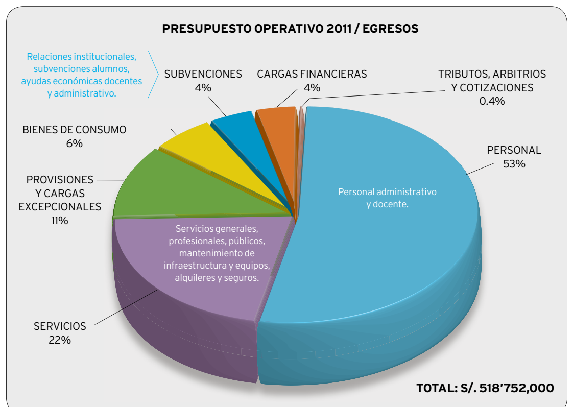
FIGURA 1. Distribución del presupuesto de la PUCP 2011 de acuerdo con los gastos estimados.

Nota: La diferencia aumentaría todavía más (especialmente para Colombia) si se considera el costo de vida y el poder adquisitivo de estos países respecto al Perú.