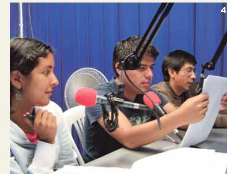
1. Penal penitenciario: alumnos de Prosode visitan a reos del penal de Lurigancho y llevan sus casos a una comisión en la que se evalúa cuáles serán atendidos. 2. Educación legal: dan charlas a niños y jóvenes en colegios de sectores menos favorecidos, a través de dinámicas que hacen más entretenido el Derecho. 3. Asesoría legal: cumplen el papel de abogados en un consultorio al revisar casos de personas que no tienen los recursos para pagar una consulta. 4. Difusión legal: a través de la radio, amplían el espectro de personas que se benefician con información legal.