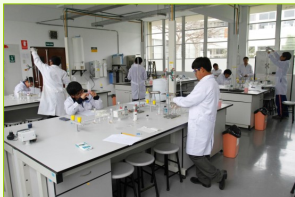
Laboratorio de Química General