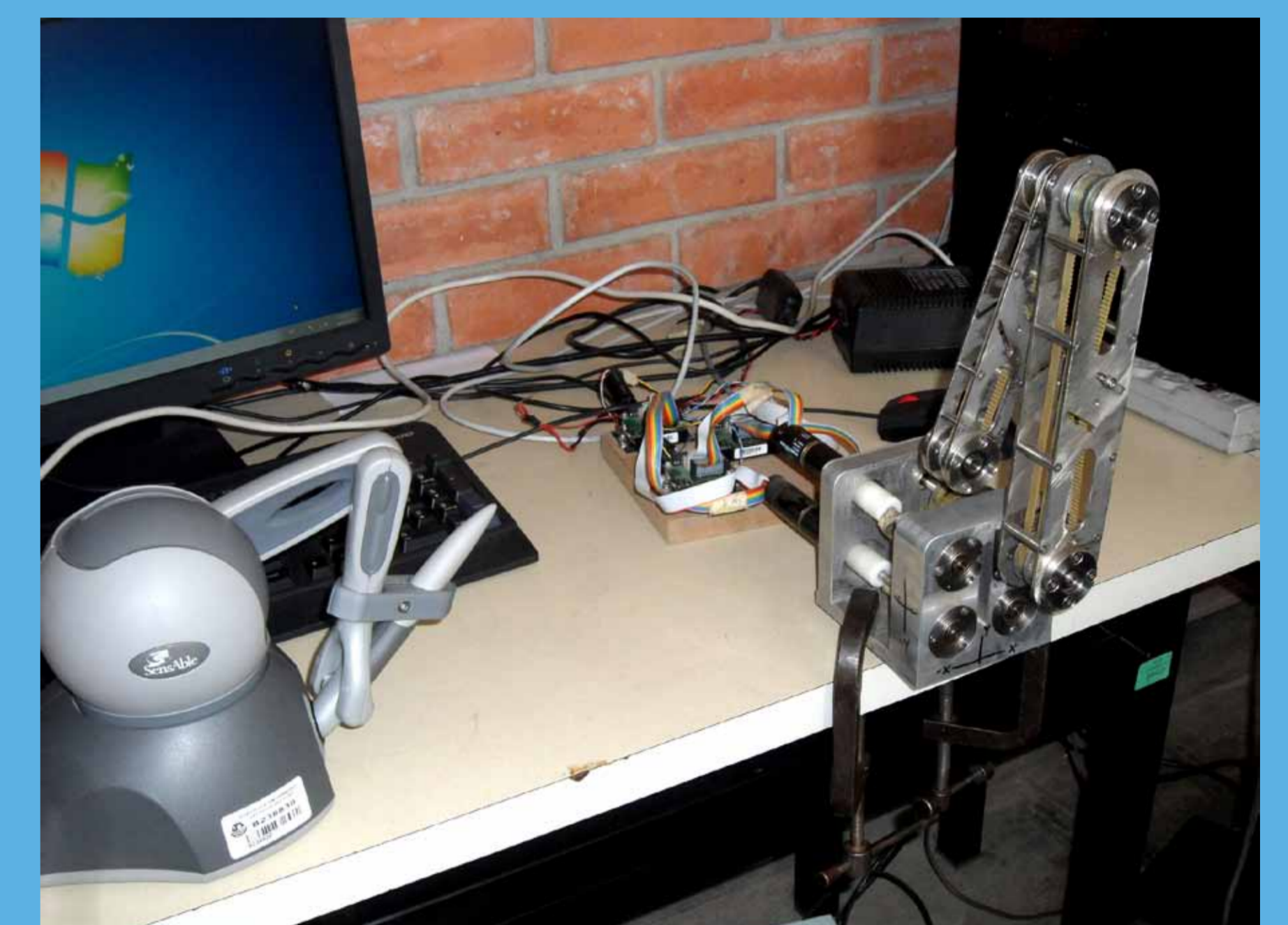
Plataforma experimental de teleoperación robótica.