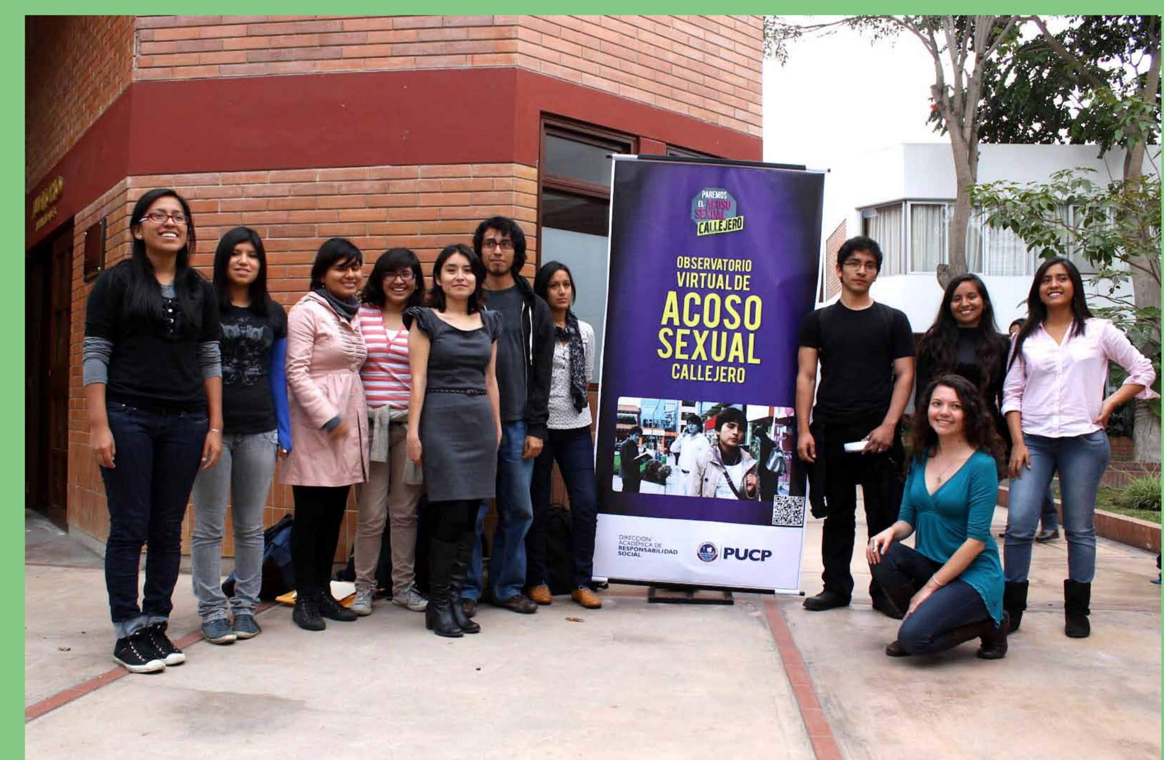
VIII Encuentro de Derechos Humanos "Ser urbano: Derechos Humanos en la ciudad". PUCP, 11 de setiembre de 2012.