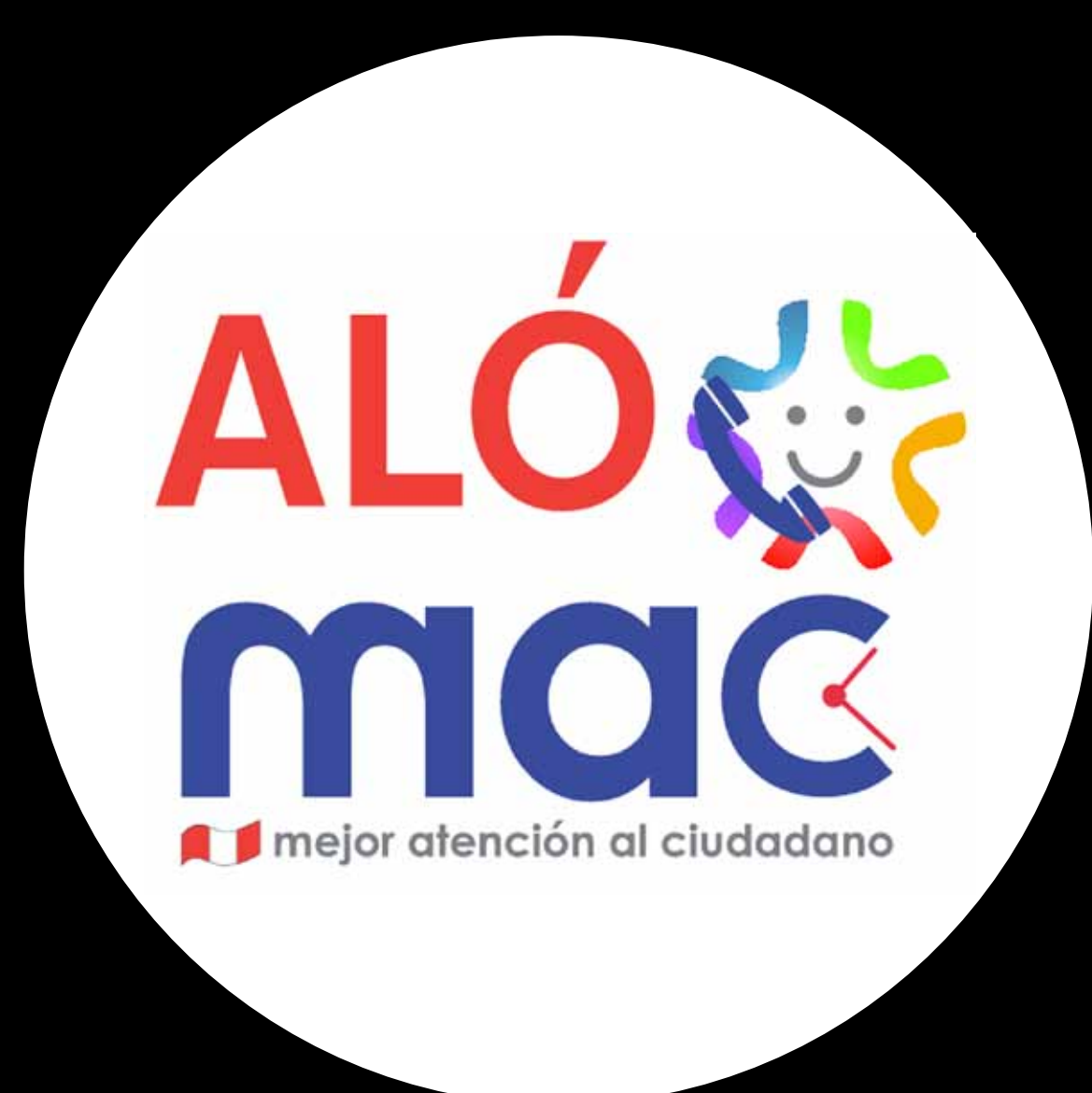
"Un solo lugar, menos tiempo". El caso del Centro de Mejor Atención al Ciudadano (MAC).