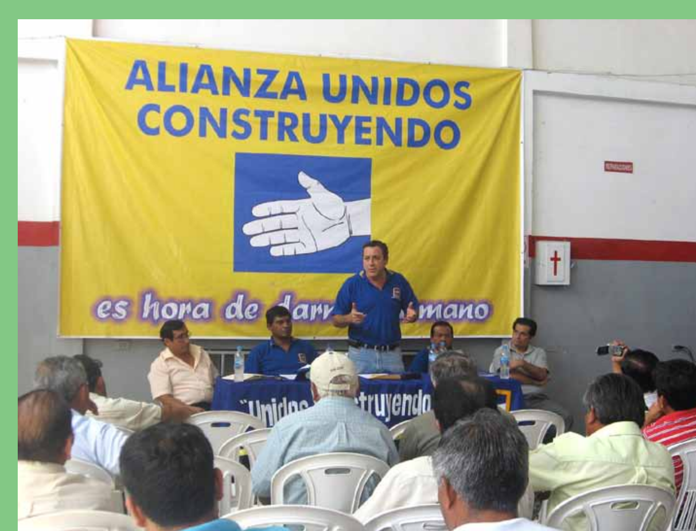
Escudo "Alianza Unidos Construyendo: Es hora de darnos la mano".

Slogan Unidos Construyendo: "Es hora de darnos la mano... es tiempo de cambiar".