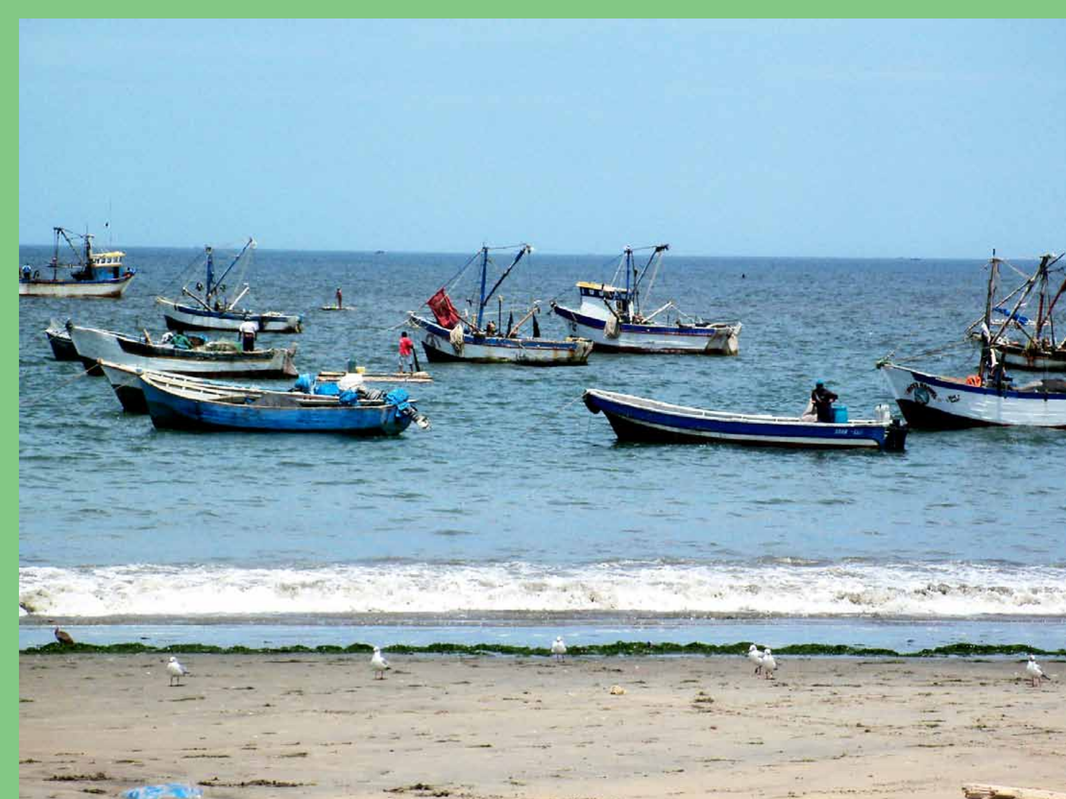
Zonas de desembarque de pesca artesanal.