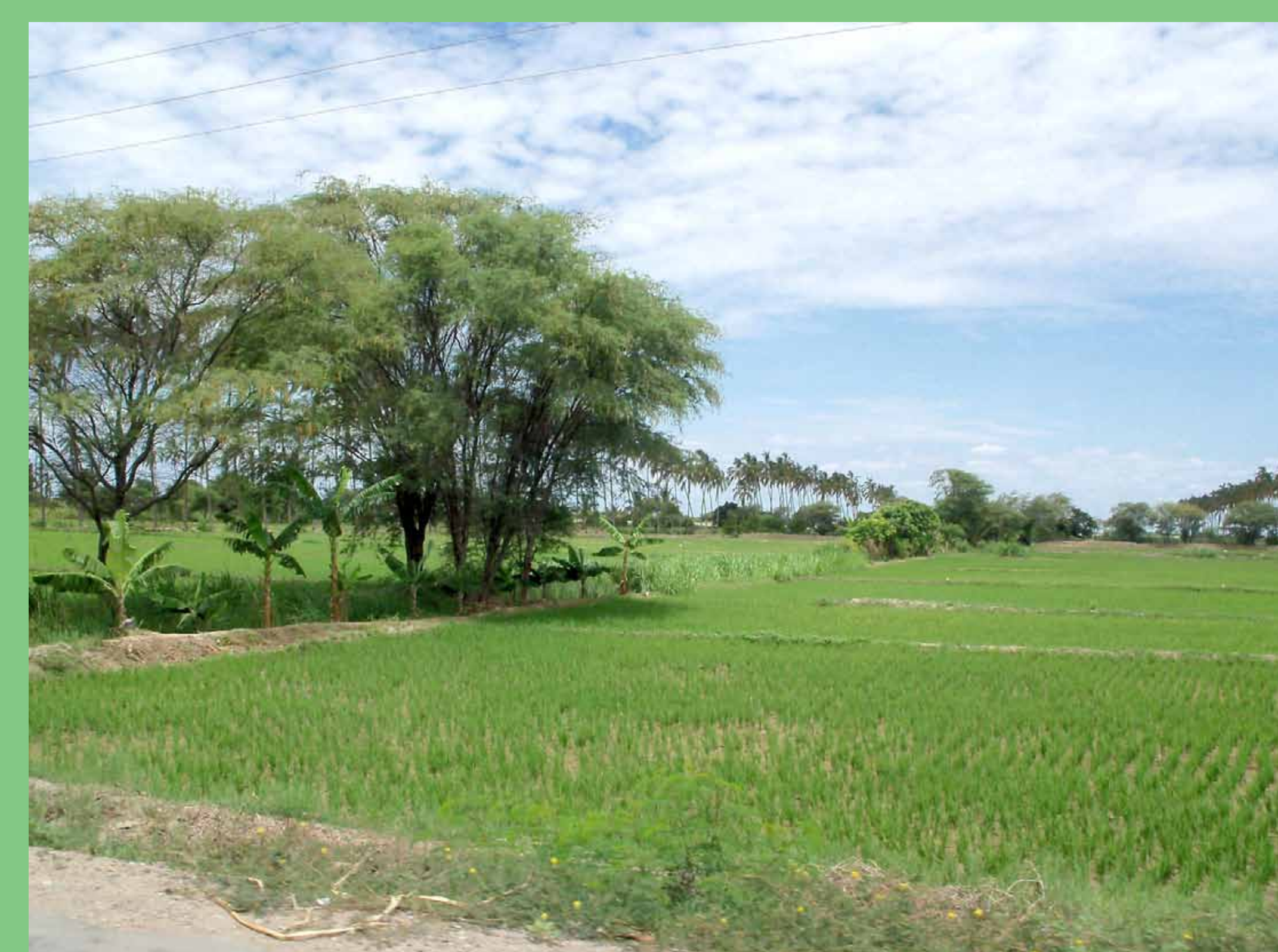
Zonas de valle irrigado, agricultura comercial.

** entendida como un campo de producción de sentidos comunes que orientan las posiciones y acciones de las poblaciones.