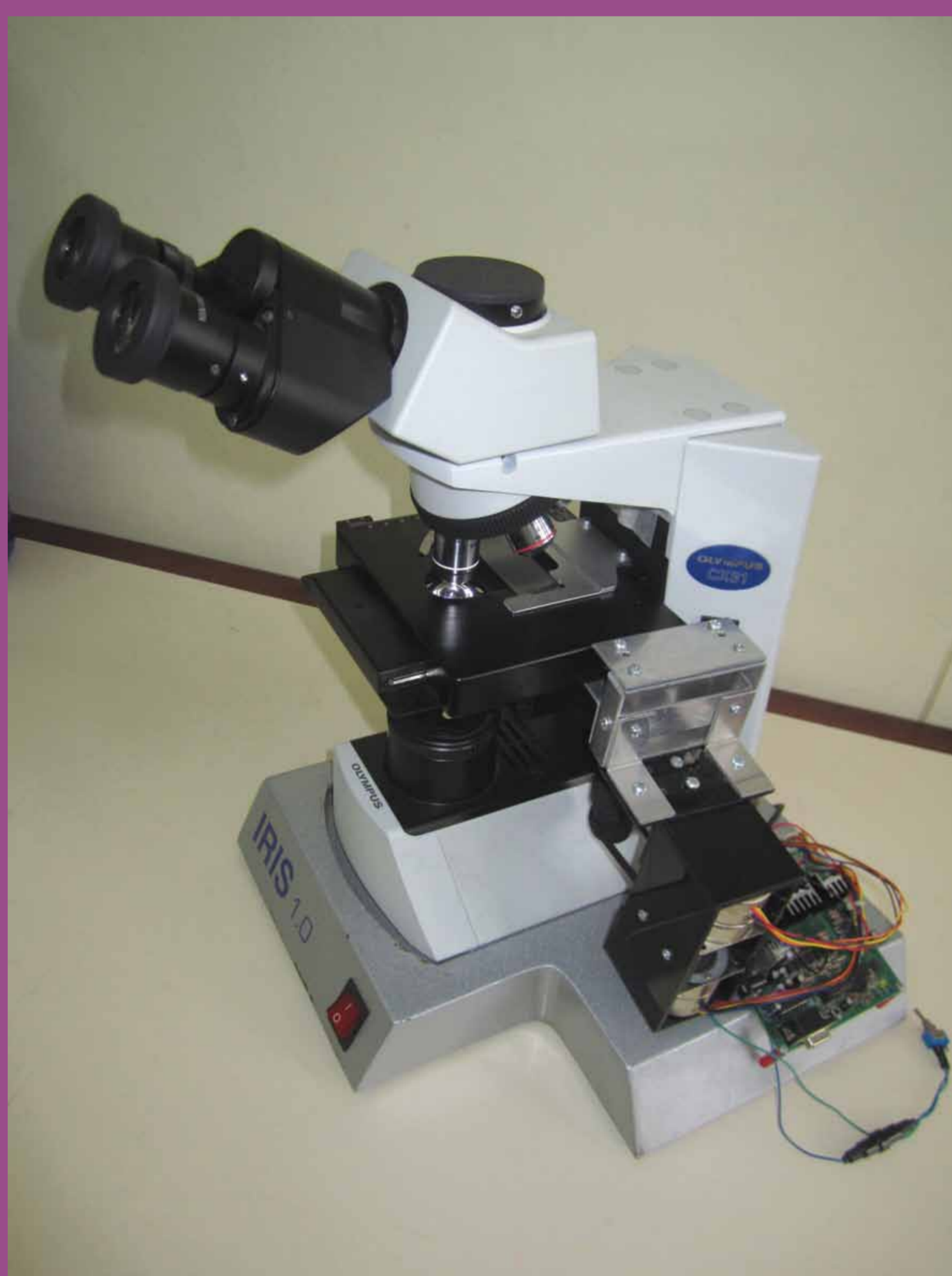
Microscopio automatizado realizado en el LIM-PUCP.