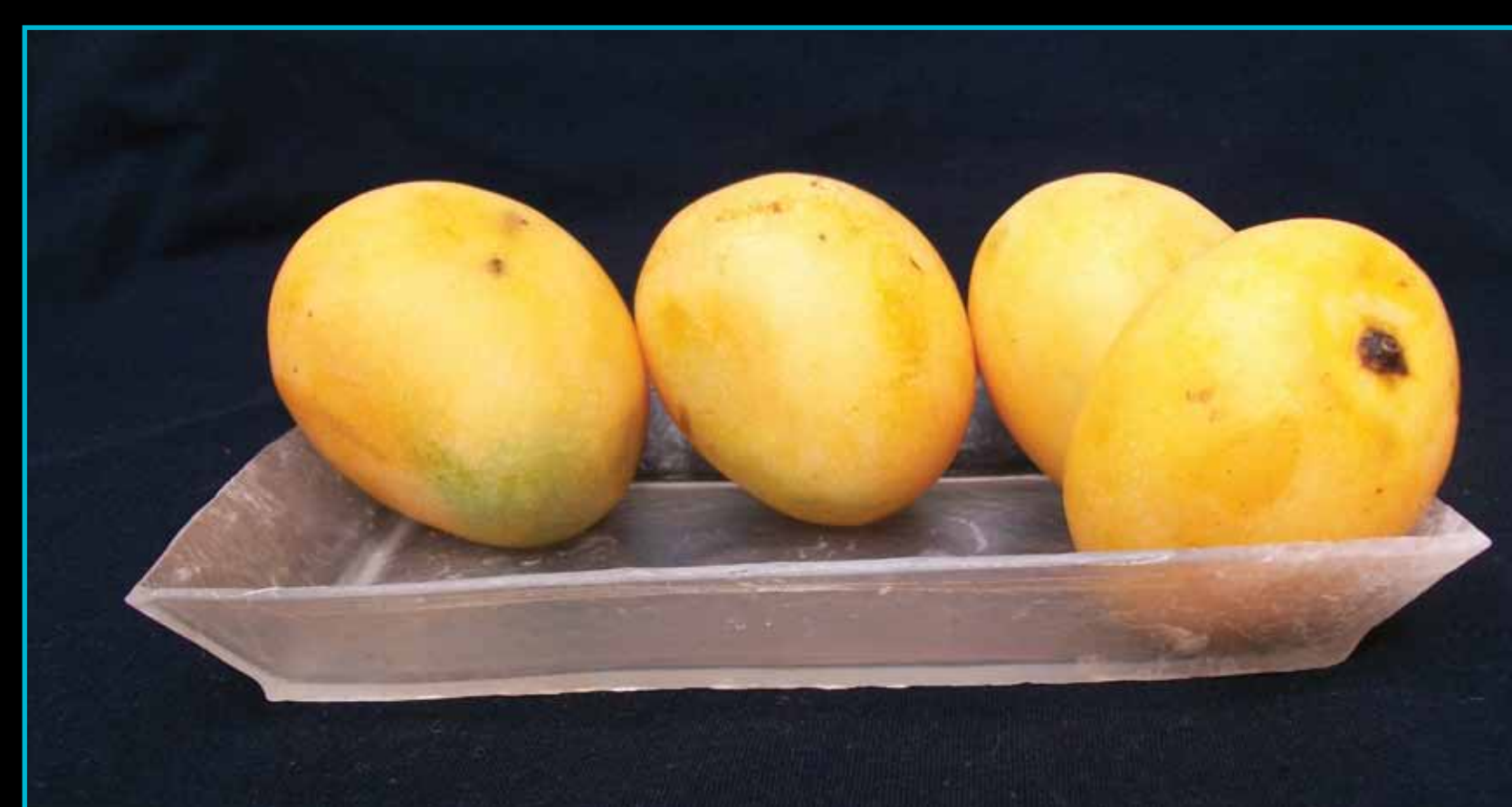
Bandeja de bioplástico de almidón biodegradable producida en los laboratorios de POLYCOM.