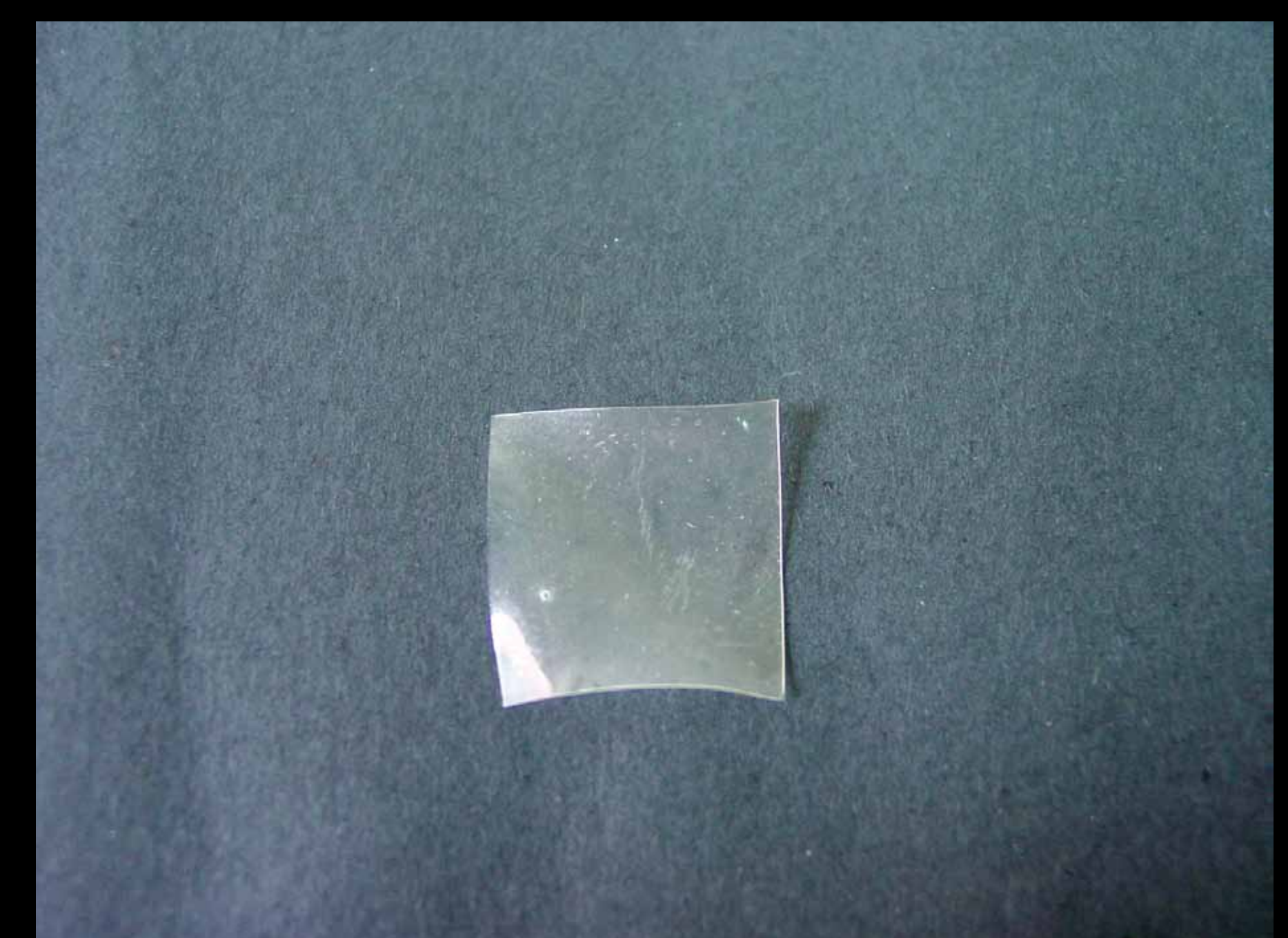
Film de almidón.