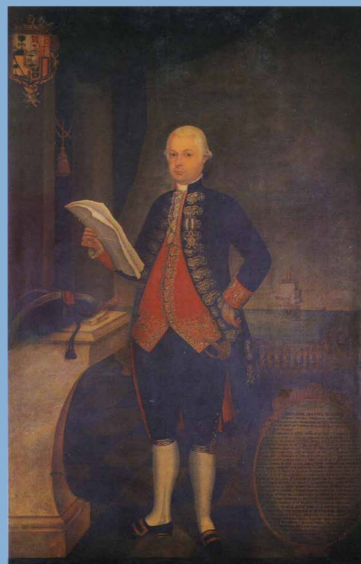
MARQUÉS TORRE TAGLE