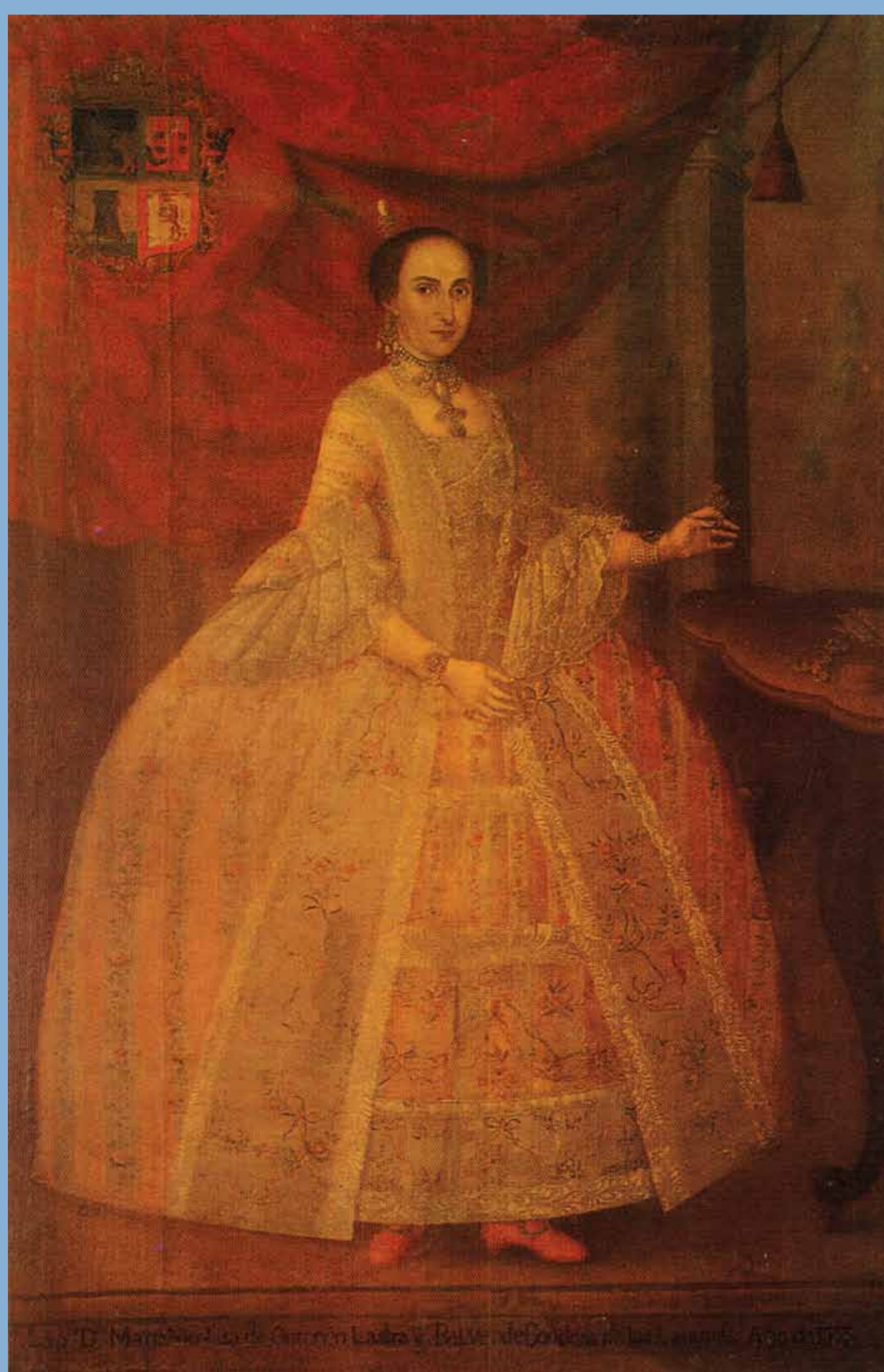
CONDESA DE LAS LAGUNAS

A todo ello puede sumarse la ejecución testamentaria —en la que aparecen los inventarios testamentarios— y la estimación del patrimonio del testador, —donde se hace descripción pormenorizada de valores, propiedades, joyas, derechos, esclavos, y un recuento cuarto por cuarto de los bienes encontrados en las viviendas—. Esta información permite un estudio privilegiado de la vida cotidiana y cultura material del personaje en cuestión.