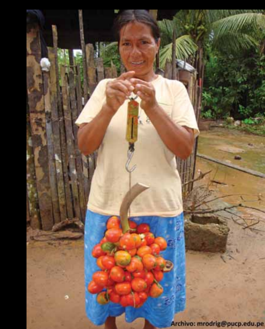
RECOLECCIÓN. C.N. Cashiriari.