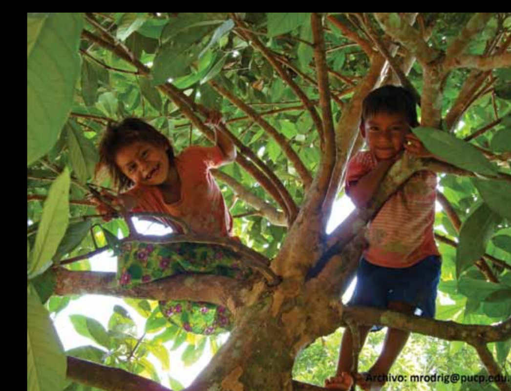
RECOLECCIÓN. C.N. Cashiriari.