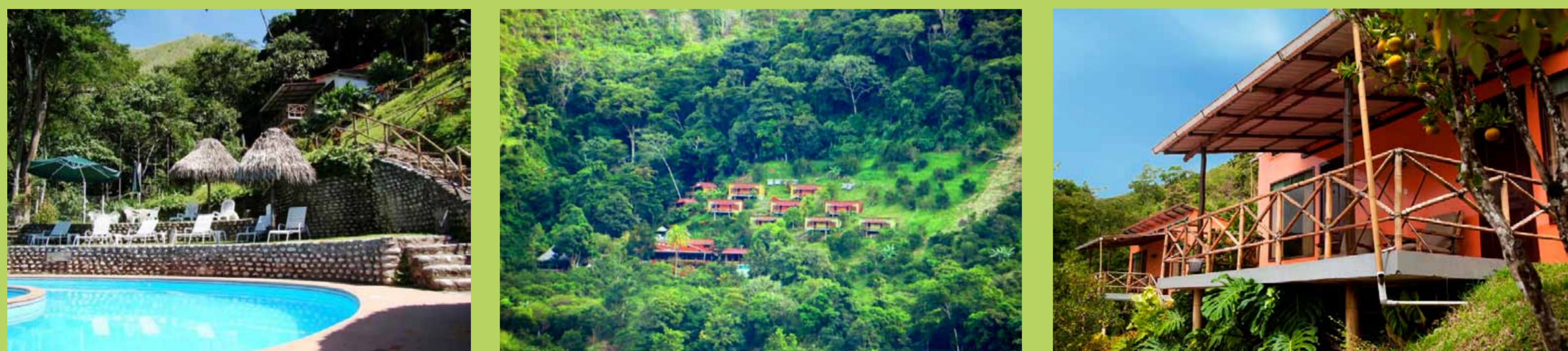
Fundo San José.

Además del producto ecoturístico, que incluye cuatro nuevos programas turísticos dentro del fundo basados en el Centro de Interpretación y el Sendero Interactivo con un Aplicativo para Smartphone y Audio Guías, se entregará un Inventario de Especies en el Bosque Primario Protegido en la Provincia de Chanchamayo por método de muestreo, y un Módulo Piloto de un Centro de Interpretación Interactivo y un Sendero Piloto para mostrar la biodiversidad de Flora y Fauna del Bosque Primario Protegido en la Provincia.