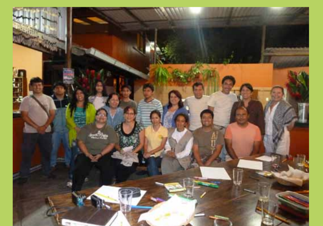
Guías locales, equipo de biólogos y equipo técnico del proyecto.