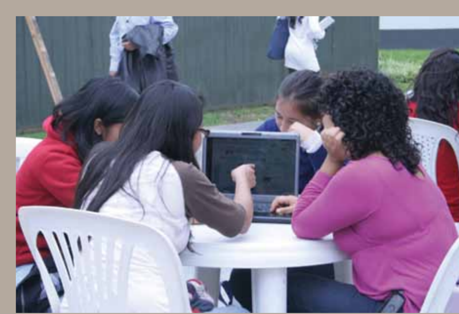
La dimensión didáctica se traduce en actividades regidas por las estrategias de la conectividad e interactividad.