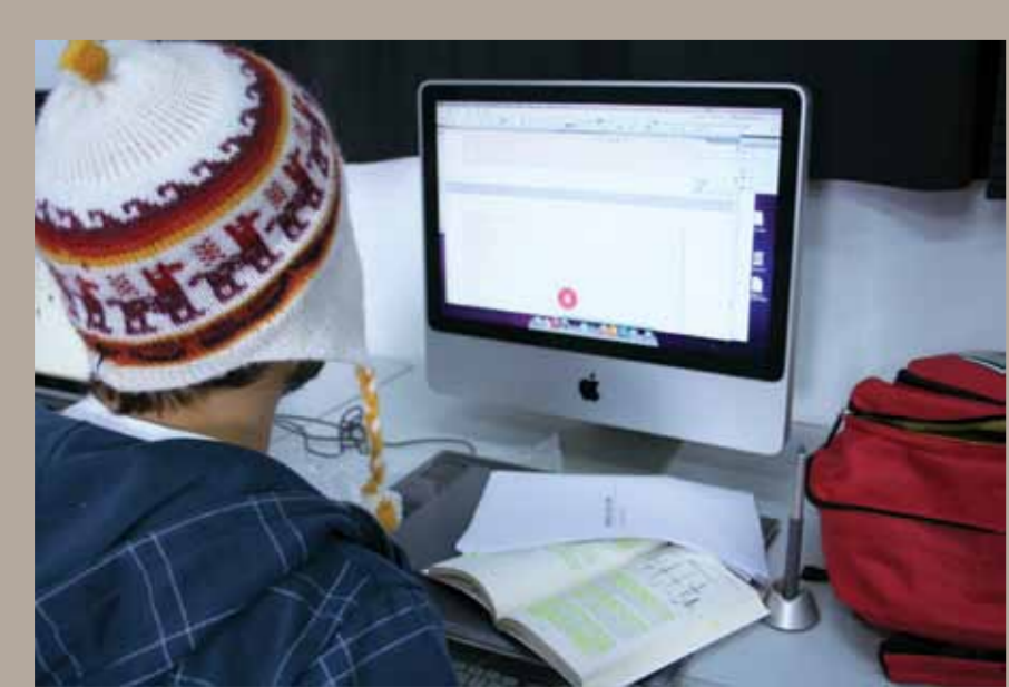
La educación virtual propone una enseñanza – aprendizaje centrada en el alumno.