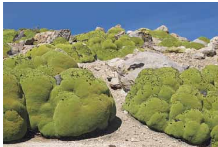
Vegetación. En medio de la desolación altoandina, una vegetación de curiosas formas de color verde esmeralda llama la atención: la yareta.