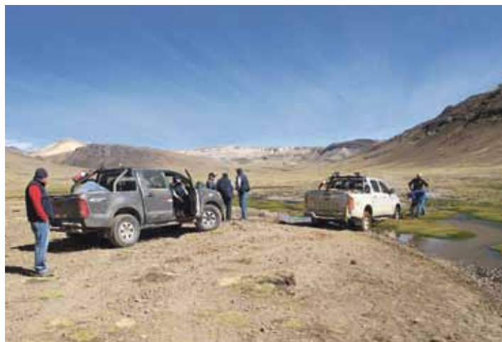
Atorados. Parte del camino a la quebrada se hizo en camionetas, y el bofedal de la zona (humedal de altura) nos detuvo más de una vez.