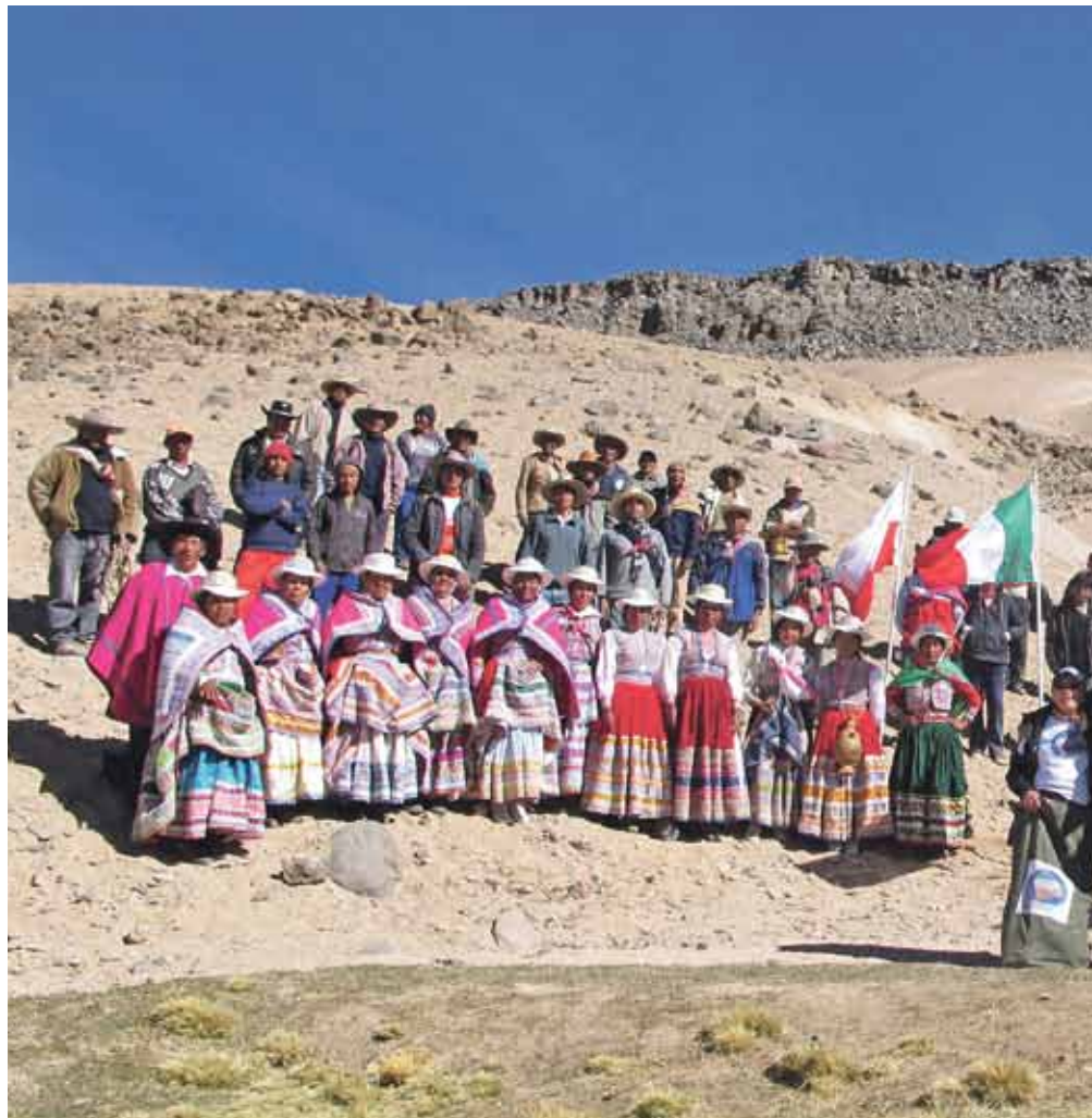
Mérito compartido. Los pobladores de Lari recibieron al grupo expedicionario, colaboraron en la colocación de la placa-monumento y realizaron una tradicional y emotiva ceremonia que contó con la participación de las autoridades locales.

La subida fue de casi 5 km (que parecieron 100) y la altura alcanzada fue de 5,170 msnm. Grande fue la sorpresa de los exploradores cuando, al llegar a la cima, se encontraron con los pobladores del distrito de Lari, quienes habían subido caminando desde el otro lado del monte por más de seis horas para ayudar en la colocación de la placa-monumento, realizar una ceremonia de inauguración y develación, y ofrecer con orgullo y humildad un tradicional pago a la pachamama.