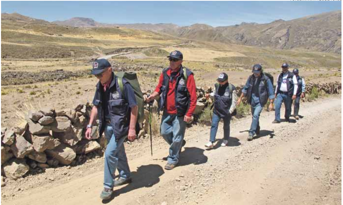
Caminata. Como parte del trabajo de aclimatación, los expedicionarios realizaron una primera caminata de cuatro horas, a más de 4,500 msnm.

ascendieron a pie por la quebrada Apacheta y dieron con el verdadero inicio.